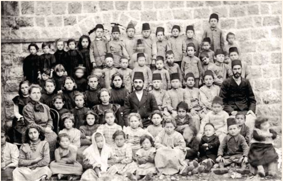
וילקומיץ ותלמידיו בראש פינה