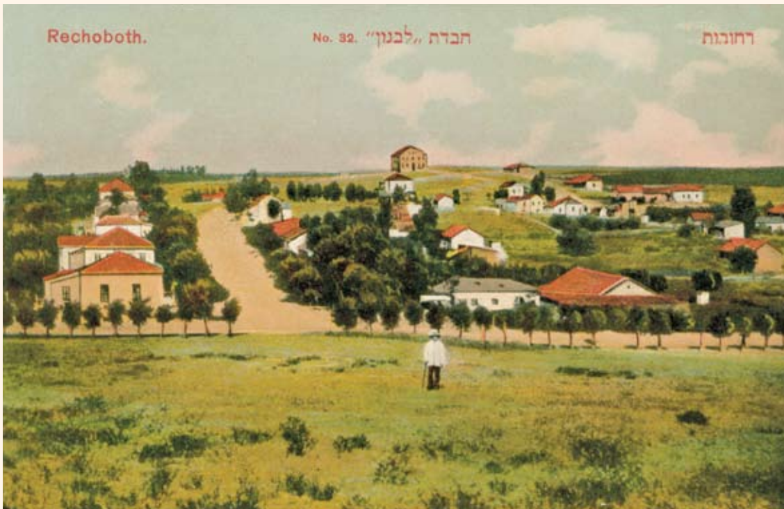
המושבה רחובות בראשיתה, גלויה