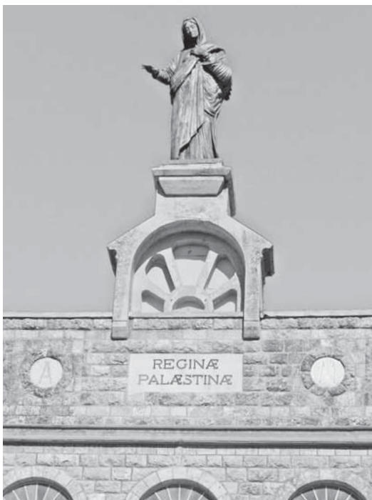
חזית מנזר דיר-רפאת ליד בית-שמש: גידול חזירים במנזרים הפך באמצע שנות החמישים לנושא במחלוקת בין נציגי הכנסייה הקתולית לראשי משרד הדתות

גידול החזיר על ידי הכנסיות הנוצריות, ממסד דתי אחר בעל עצמה שצריך היה להתחשב בו, היווה בעיה מיוחדת לנאבקים בחזיר. כבר בעת הניסיון לרכז את החזירים באזור הצפון באמצעות צווים מנהליים, בשלהי 1953, בוטל הצו שניתן לדיר של ההוספיס של נזירות מסדר סנט צ'רלס ברתולומיאו במושבה הגרמנית בירושלים, לאחר שאנשי המסדר הגישו הצהרה חתומה שעשרות החזירים שבמקום הם לתצרוכת פנימית בלבד. 106 נציג הפטריארך הלטיני בישראל מונסיניור ורגאני פנה אל המחלקה לעדות הנוצריות במשרד הדתות בעניין המנזר בדיר-רפאת שליד בית-שמש, שתוכנן בו לדבריו משק חקלאי גדול, כולל עדרי בקר וחזירים, שיתמוך בכתי הספר הקתוליים בגליל. 107 הוא דחה את טענת ורהפטיג שגידול החזירים הוא חלק מ'החלשת הרוח הדתית במדינה והתפשטות האתאיזם', האמורים להפריע