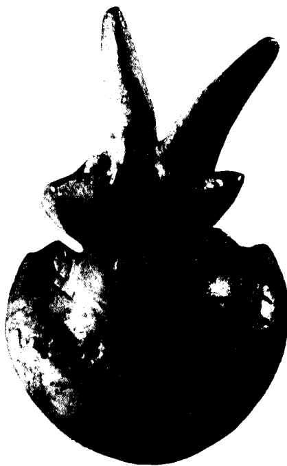
רימון הנושא כתובת הכוללת את הביטוי 'קדשכהנמ'

ואולם אם נצא מן ההנחה שסימנים אלה הם ק"כ, אפשר שיש כאן קיצור ל'קודש כהנים' — ביטוי שלא נמצא בתנ"ך ובאפיגראפיה עברית עתיקה עד לזמן האחרון. למייר פירסם לא מכבר רימון קראמיקה קטן, שנמצא אצל סוכן עתיקות בירושלים, הנושא את הכתובת: 'לבינת יהוה קדש כהנים'; 5 דבר המחזק את ההצעה שהעלינו עוד ב-1965. 6 את הצעתו של קרוס מפריכות אותיות הכתב, צורת הקערות והסטרטיגראפיה.