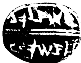
חותם אלישיב בן ישעיהו וטביעתו