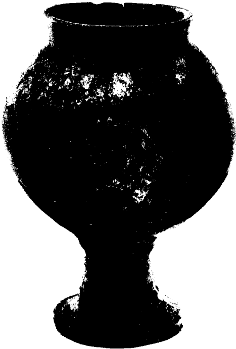
קדרה. ערד, שכבה 7

נלקח לבבל, משום שאשורבניפל עדיין היה עסוק שם. עם חזרתו, לאחר ששיכנע את מלך אשור שהוא יהיה לו צמית נאמן, סילק מנשה את הפולחנים הפרו-צוריים, ואף החל למנות מפקדים למרכזים המבוצרים ביהודה. הוא גם החל בבניית החומה הידועה בירושלים. אין טעם לראות פסוקים אלה כהמצאה של מחבר דברי הימים, אך יש להכיר בכך שחזרתו בתשובה של מנשה והתהפכות היוצרות שנבעה מכך, אירעו לא לפני 648 לפני הספירה. על-כן, בניית שכבה 7 בערד וחיידוש מצודות אחרות בנגב, כגון תל-עירא, לא היו אפשריים לפני שנה זו. תוך כשש שנים הגיעה מלכותו של מנשה לקיצה. 53 על-אף ששיבתו לכס המלוכה פירושה היה שתמיכת אשור נתונה לו עתה, והדבר כלל כנראה סיוע כספי לשיקום ארצו, הוא אך הספיק להתחיל בשינויים הקיצוניים במפה הגיאוגרפית המקומית, שאנו מוצאים בסוף המאה השביעית. ואולם הגיעה העת הנכונה לתקומתה של יהודה. חסדו של אשורבניפל סר מעל הפיניקים והערבים, ואילו המצרים היו עצמאים ואולי אף ביקשו את תמיכת הפלשתים בעזה ובמקומות אחרים. וכך החליט מלך אשור לשים את מבטחו במנשה, כדי לייצב את האזור. מותו של מלך יהודה הקשיש בשנת 642 לפני הספירה הביא לאנדרלמוסיה מדינית בירושלים, שנסתיימה ברצח בנו, אמון. 54