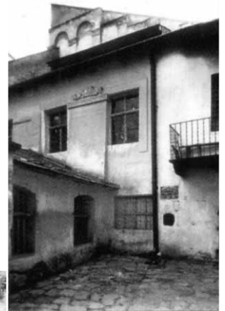
בית הכנסת 'טורי זהב' על שמו של ר' דוד הלוי סגל, בעל הגהות 'טורי זהב' על 'שולחן ערוך'; נפטר בלמברג בשנת 1667. איור ישן ותצלום מראשית המאה העשרים