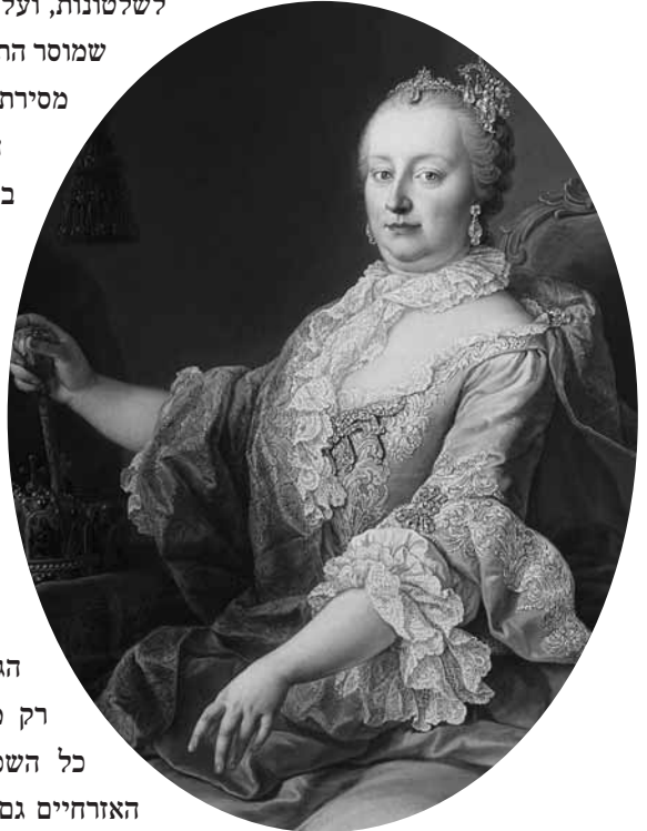
הקיסרית האוסטרית מריה תרזה (1780-1717)

הקודקסים של החוק האזרחי הכללי ושל חוק העונשין הופיעו באוסטריה רק שנים ספורות קודם לכן, ועם פרסומם הסתיים תהליך חקיקה ארוך שהחל עוד בימיה של מריה תרזה. 4 הקודקסים הללו הגדירו לראשונה באופן אחיד עבור כל מדינות הכתר את מערכת היחסים בין המדינה לנתיניה, על החובות והזכויות של כל צד. קודקסים אלו לא היוו חוקה מובנה המודרני, ואוסטריה לא הפכה בראשית המאה התשע-עשרה למדינה ליברלית, אבל היא הייתה בהחלט מדינת חוק (Rechtsstaat). 5