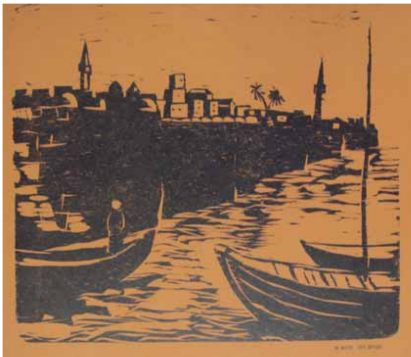
עכו, חיתוך עץ, מנחם רון (וכסלר), 1955

בלטה בתחום הבעלות על הקרקע משפחת פידון, שמוצאה מביירות, ושהיגרה כנראה לעכו בתחילת המאה התשע-עשרה. 113