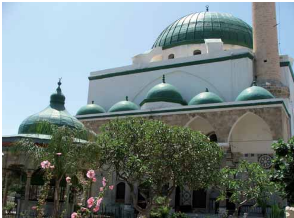
מסגד אלג'זאר בעכו

מחקר המקרה של עכו עולה כי עם העילית העירונית נמנו שלוש קבוצות של משפחות, שהתאפיינו בעיסוקיהן ובמקורות המחיה שלהן: משפחות עולמאא (חכמי הדת) ואנשי דת אחרים, משפחות שעסקו במנהל ובפקידות ומשפחות בעלי קרקעות וסוחרים. יש להדגיש כי חלוקה זו של המשפחות בהתאם לעיסוקיהן לא הייתה חדה וברורה, ואין זה מן הנמנע שמשפחות עולמאא החזיקו גם באדמות או עסקו בפקידות. ולמרות זאת החלוקה כאן מתבססת על המאפיין התעסוקתי הבולט ביותר של המשפחות בתקופה הנדונה, תוך ציון התמורות שחלו בעיסוקיהם של אחדים מבניהן לאורך הדורות.