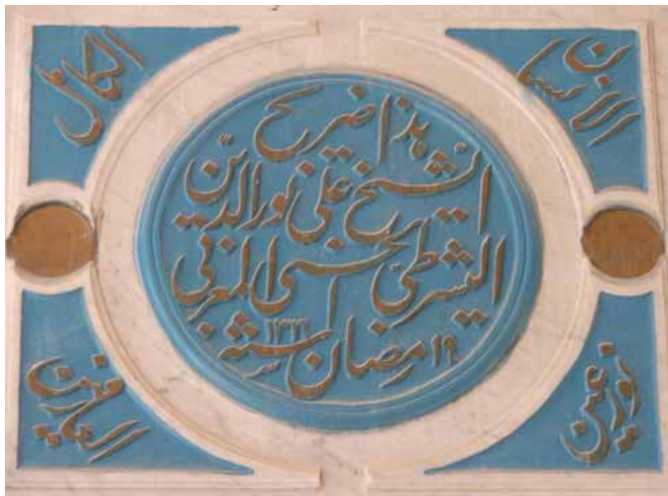
למטה: קברו של שיח' המסדר השאד'לי, עלי נור א-דין אלישרטי. מימין: עיטור מעל שער חדר הקבורה של השיח'. הכיתוב במרכז העיטור: זהו קברו של שיח' עלי נור אלדין אלישרטי אלמג'רבי 19 ברמזאן 1316 (= 1 בפברואר 1891). בפנינת העיטור נכתב הפתגם הצופי 'האדם המושלם אור עיני היודעים'