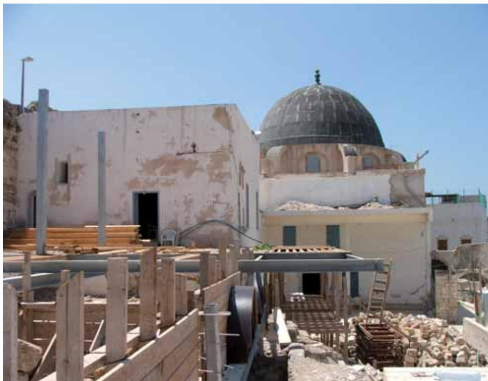
הזאוויה השאד'לית בתמונה עכשווית

שיח' אסעד נולד בעכו בתאריך לא ידוע. את לימודיו היסודיים והתיכוניים עשה בעיר, ובשנת 1875 נסע לאוניברסיטת אלאזהר להשלים בה את לימודי הדת שלו. עם חזרתו לעכו הצטרף למערכת המשפט השרעית, ולאחר מכן מונה לשופט שרעי בשפרעם. בשנת 1904 נתמנה לשופט חוקר (מסתנטק) בעיר לאד'קיה. בשנת 1905 עבר לאיסתנבול, שם חבר לשיח' אבו אלהודא א-ציאדי, מנהיג המסדר הצופי הרפאעי וממקורביו של הסלטאן עבד אלחמיד השני. באיסתנבול מונה שיח' אסעד למנהל הכללי של ספריית הסלטאן, 27 ולאחר מכן מונה ליושב ראש בית המשפט השרעי לערעורים בעיר אדנה. שם נשא את אשתו הראשונה, וממנה נולדו בניו אנו, עפו ועב אלעפו. מאוחר יותר נשא באיסתנבול אישה שנייה, וממנה נולד לו בנו אחמד, והוא שיסד את אש"ף בשנת 1964. עם חידוש הפעילות הפרלמנטרית והחוקתית באימפריה העות'מאנית, בשנת 1908, נבחר שיח' אסעד לנציג מחוז עכו בפרלמנט העות'מאני (מג'לס אלמבעות'אן). באיסתנבול התקרב לאגודת 'האחרות והקדמה', הוא הפך עד מהרה לאחד מעמודי התווך שלה וייסד עם פעילים מהארץ את הסניף שלה בירושלים. בשנת 1912 נבחר לקדנציה שנייה בפרלמנט העות'מאני, והמשיך לכהן בו עד 1914. 28