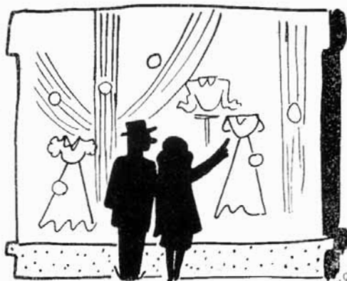
מה שהיא רואה...