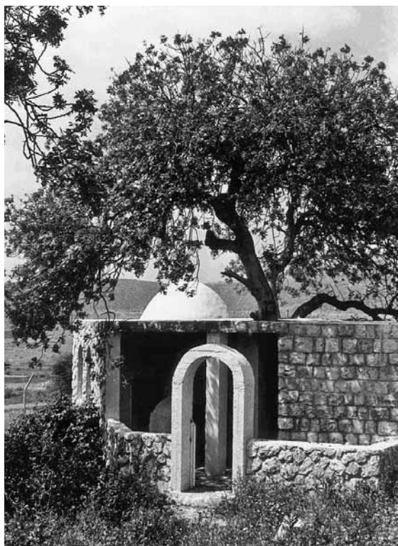
איור 9 (למטה): חוקוק, קבר חבקוק, המבנה החדש שהוקם מעל מצבת הקבר

מופיע ליד הקבר עץ אלה ענף, שלא נזכר אף באחד מן המקורות הקדומים. מנחם בן פרץ החברוני, שביקר במקום בשנת 1215 54 והאלמוני איש קנדיאה שביקר במקום בשנת 1473 55 ציינו שקבר חבקוק היה ליד מעיין. המעיין הנזכר הוא עין יאקוק, המרוחק כ-300 מ' מהקבר הנוכחי, ודברי שני הנוסעים אינם עולים בקנה אחד עם מקומו הנוכחי של הקבר.