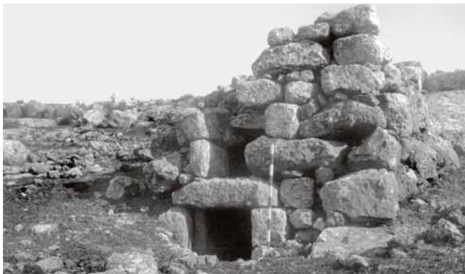
איור 12: כפר חנניה, קבר ר' חנניה בן עקשיא; פתח מערת הקבורה והציון הבנוי מעליה, שנות החמישים של המאה העשרים

קברי חלפתא ו'בניו' מלמד שמסורת הקבורה שלהם נדרה במהלך ימי הביניים בתוך המתחם של כפר חנניה. מקצת הנוסעים שביקרו במקום במאה השתיים-עשרה והשלוש-עשרה זיהו את הקברים במערה גדולה חצובה סמוך לכפר ('מערת עשרים וארבעה התלמידים'), ואחרים זיהו אותם במישור שמדרום לו. את קיבועה של מסורת הקבורה במקומה הנוכחי למן המאה השש-עשרה יש לקשור למציאות של העץ הגדול, הבולט על רקע המישור הפתוח. ליד העץ זוהה קברו של חלפתא, ונבנה עליו ציון רבוע מאבני לקט, וסמוך לו הוצבו שני ארונות קבורה והם זוהו כמקום קבורתם של יוסי ושמעון. מסורת קבורה זו השתמרה באופן רצוף למן המאה השש-עשרה ועד ימינו אלה (איור 11).