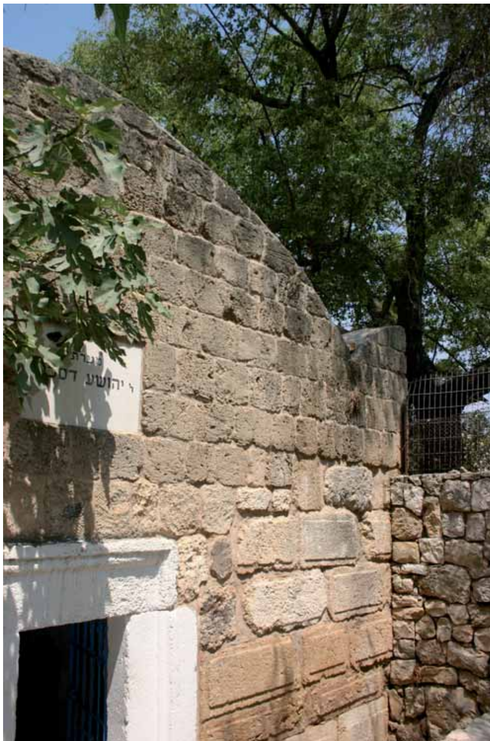
איור 3: קבר ר' יהושע דסכנין, חזית המבנה