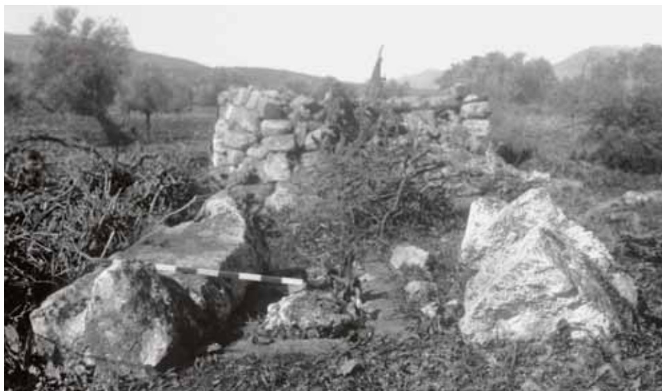
איור 11: כפר חנניה, ציון ר' חלפתא ושני ארונות הקבורה של בניו, ר' יוסי ור' שמעון, שנות החמישים של המאה העשרים

ניתן לשער כי משחרל להתקיים היישוב היהודי בגוש־חלב, בסוף המאה השש־עשרה, ועם הרעת מצב הביטחון באזור במאה השבע־עשרה והשמונה־עשרה, נפסקו ביקורי עולי רגל במקום, ובעקבות זאת הלך ונשתכח מקומם של הקברים הקדומים. במועד לא ידוע במאה העשרים זוהה קברם של שמעיה ואבטליון בארון הקבורה שהיה מוטל בשטח, והקמת מבנה האבן הפכה את האתר למקום קבורתם הרשמי של שני האישים. קבריהם הקדומים של שמעיה ואבטליון, ושל 'אבות אבותיהם' אדרמלך ושראצר, היו בלי ספק במקום אחר, אי שם מדרום לכפר, באתר שעקב תנופת הבנייה והפיתוח לא ניתן לזהותו.