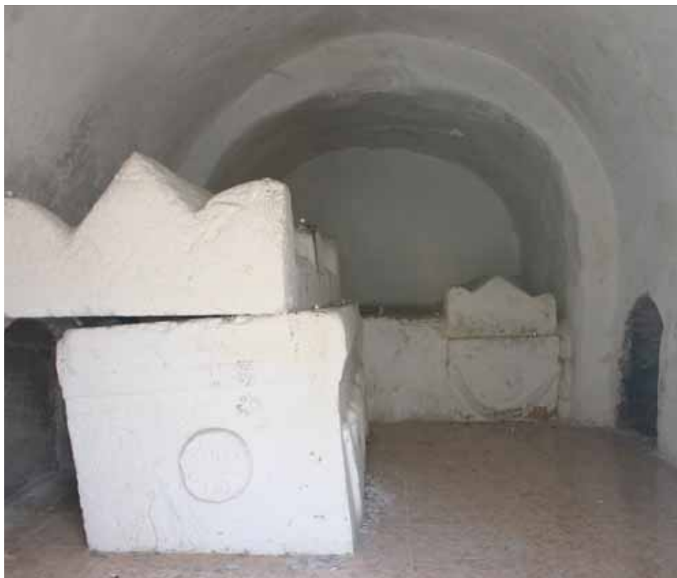
איור 4: קבר ר' יהושע דסכנין, מערת הקבורה

עשרה מופיעה רק רשימה של שמות הנקברים בסכנין. 22 אך ויקטור גרן, שביקר בסכנין בשנת 1875, תיאר בדיוק רב את הקבר ואת העץ שצמח סמוך לו וציין כי האתר היה מקודש הן למוסלמים הן ליהודים. 23