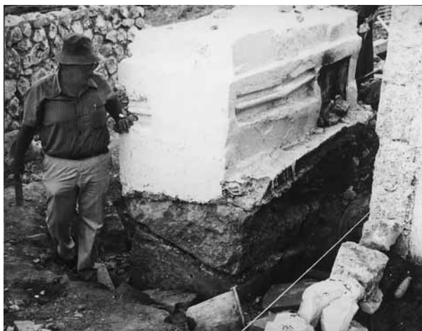
איור 5 (למעלה):

24 קבר יונתן בן עוזיאל, עמוקה