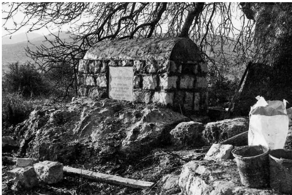
איור 8 (מימין): חוקוק, העץ ומצבת הקבר שהוקמה לצדו