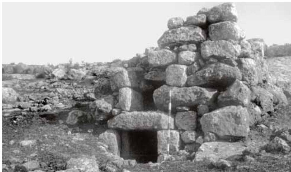
איור 12: כפר חנניה, קבר ר' חנניה בן עקשיא; פתח מערת הקבורה והציון הבנוי מעליה, שנות החמישים של המאה העשרים

קברי חלפתא ו'בניו' מלמד שמסורת הקבורה שלהם נדרה במהלך ימי הביניים בתוך המתחם של כפר חנניה. מקצת הנוסעים שביקרו במקום במאה השתיים-עשרה והשלוש-עשרה זיהו את הקברים במערה גדולה חצובה סמוך לכפר ('מערת עשרים וארבעה התלמידים'), ואחרים זיהו אותם במישור שמדרום לו. את קיבועה של מסורת הקבורה במקומה הנוכחי למן המאה השש-עשרה יש לקשור למציאות של העץ הגדול, הבולט על רקע המישור הפתוח. ליד העץ זוהה קברו של חלפתא, ונבנה עליו ציון רבוע מאבני לקט, וסמוך לו הוצבו שני ארונות קבורה והם זוהו כמקום קבורתם של יוסי ושמעון. מסורת קבורה זו השתמרה באופן רצוף למן המאה השש-עשרה ועד ימינו אלה (איור 11).