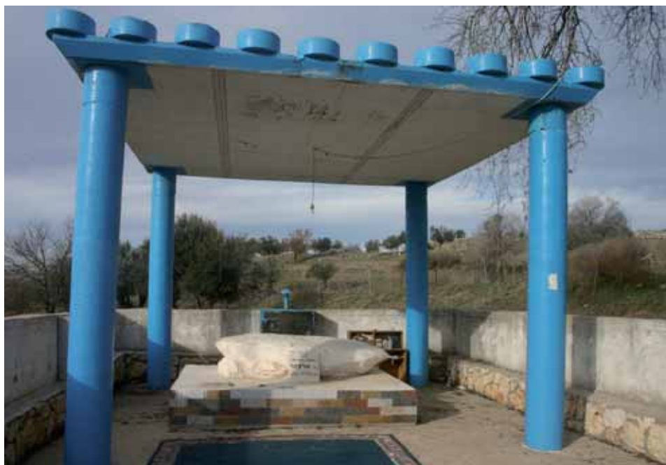
איור 14: עלמה, קבר ר' אלעזר בן עזריה כפי שהוא נראה היום

במקורות מן המאה החמש-עשרה לא נזכר שום מאפיין בולט של הקבר, אך בראשית המאה השש-עשרה – לכל המאוחר – חלה בו תמורה בולטת. משה באסולה תיאר אותו בשנת 1523 כ'קבר של אבן שיש ומכסה של אבן גדול עליו', והוסיף וסיפר כי 'זה כמו ארבעי'ם] שנה לקחו הישמעאלי'ם] המכסה ההוא לעשותו רחים, ונשאו אותו הרבה בני אדם למקום רחוק, ולמחרת מצאוהו על קברו, הכל מעידי'ם] על זה'. 91 ריישר חזר על סיפור זה בשנת 1868, 92 ואילו אברהם ישמעאל חי סנגויניטי ציין בשנת 1742 כי אלעזר בן ערך 'קבור בפני עצמו באבן אחת גבוהה קומת אדם וארוכה חקוקה באמצע, והצדיק נתון בתוכה ומכוסה באבן אחרת גדולה כמינן תיבה אחת, והוא מונח בגן אחד, וכל הגויים מקטירים לכבודו ומדליקים נרות'. 93 דומה כי הסיפור על שכחו של המקום הקדוש בא להבהיר באילו נסיבות התקדש הקבר בקדושה יתרה גם לתושבים המקומיים, לאחר שראו את הנפלאות שעשה הצדיק היהודי למוסלמים שלא האמינו בקדושתו. 94