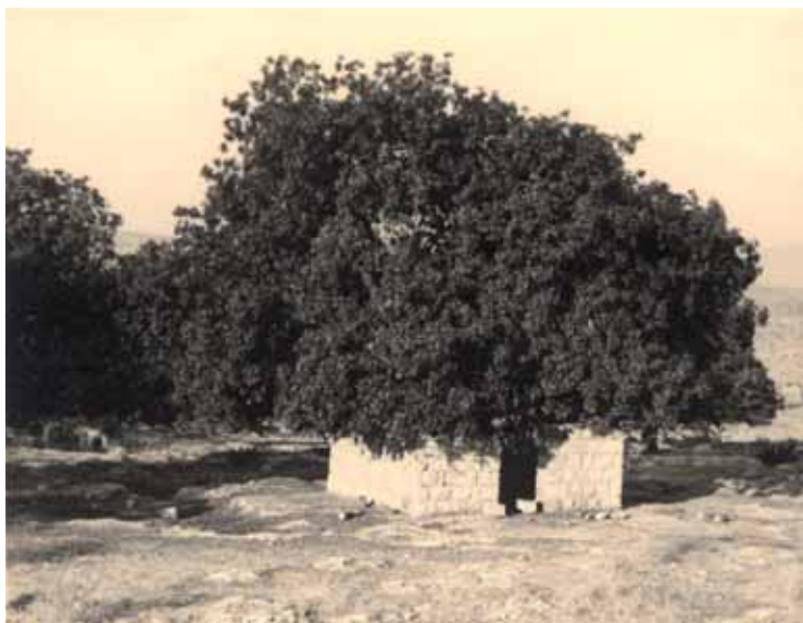
איור 7: חוקוק, מבנה רבוע ועץ (באדיסת יואב פוגלסון)