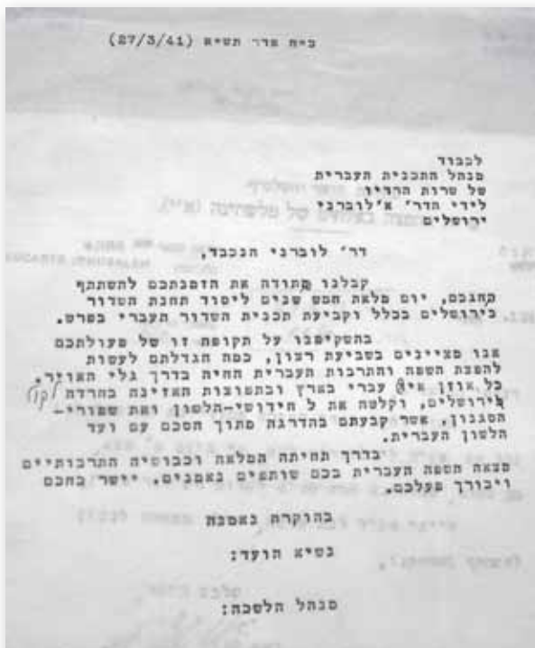
תשובת ועד הלשון ל'קול ירושלים' ובה דברי שבח

ראוי לציין שמלבד העשרת אוצר המילים של השפה, על ידי המצאת מונחים שלא היו קיימים בעברית התנ"כית, והנחלת הגייה נכונה לציבור, גייס ועד הלשון את הרדיו לפעול 'לסיכול השרשת נטיות לועזיות בשפה'. 83