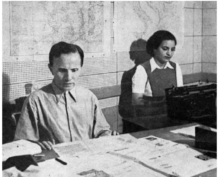
עורכי החדשות בעברית בעת שידור, מתוך 'הגלגל', 20 ביולי 1944

לידי ביטוי בנוהלי עבודה קפדניים, וביניהם חובת העובדים לנהוג בכבוד כראוי למעמדם ולמשל לכוא לעבודה בחליפות. בשידור חויבו הקריינים לשמור על תבניות לשוניות קבועות בפנייה אל המאזינים, במסירת מידע חדשותי, בהצגת נעימות מוזיקליות ובהעברת השידור ממגיש אחד לאחר. כל חריגה מאופן הפנייה המקובל הייתה מועדת לסנקציה מצד מנהלי השידור ולעתים גם לתגובות רוגזות מצד ציבור המאזינים. למרות זאת כבר בימיו הראשונים של הרדיו הארץ-ישראלי התגלו בקיעים בסגנון הפורמלי ונעשו ניסיונות להשרות על השידור אווירה קלילה ואינטימית יותר. חצי מאה לאחר הקמת התחנה נזכרו