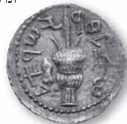
מטבע של בר-כוכבא ועליו אנד ארבעת המינים

ומיכאל לקר. 18 ההקפדה להיזקק להיסטוריה ולספרות הרומית מזווית ראייתו של היסטוריון מובהק של העולם הקלסי, ולחלופין המאמץ לנצל מקורות בערבית השופכים אור ייחודי – ולעתים בלעדי – על הגאוגרפיה ועל ההיסטוריה האיראנית בשלהי העת העתיקה ובראשית התקופה המוסלמית, הרחיבו באופן משמעותי את הבסיס ההיסטורי