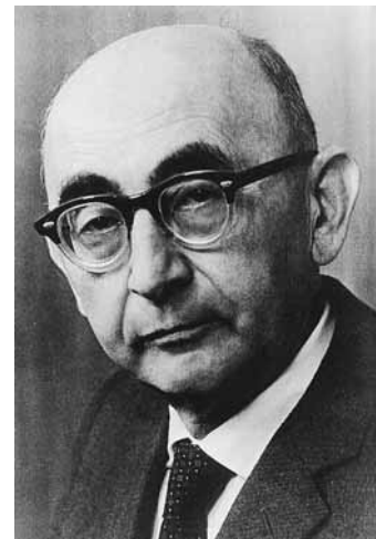
ההיסטוריון יעקב כ"ץ, רקטור האוניברסיטה העברית 1969-1972

עדות לחשש הפרופסורה הירושלמית מהתפתחות מאבק סטודנטיאלי בסגנון ובעצמה שאפיינו מרידות הסטודנטים בחו"ל יש בדברים שכתב רקטור האוניברסיטה העברית דאז, יעקב כ"ץ. בספרו האוטוביוגרפי הדגיש כ"ץ כי המאבק שהתנהל בקמפוס גבעת רם נתפס כבעל השפעה מכרעת על ההשכלה הגבוהה בארץ. כ"ץ חשש כי ניהול לא תקין של המאבק עם הסטודנטים עלול להוביל לאבדן או להפחתה משמעותית בהשפעת הפרופסורה על ניהול האוניברסיטה, וכי השלכותיו על הפוליטיקה שמחוץ למוסד יכולות להיות מרחיקות לכת: