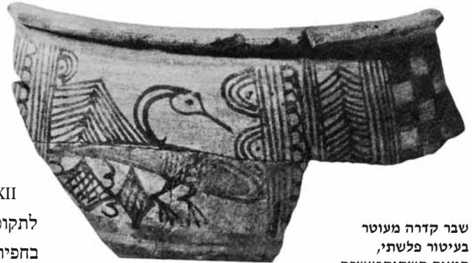
שבר קדרה מעוטרת בעיטור פלשתי, המאה השתים-עשרה לפסה"נ, אשדוד

באשדוד התגלתה שכבת שרפה במעבר מתקופת הברונזה המאוחרת לתקופת הברזל א (סוף שכבה XIV), ודומה שהעיר חרבה אז, לפחות בחלקה. שכבה XIII היא שכבת מעבר, ולדברי החופר נחשפו בה כלים מטיפוס מונוכרום פלשתי. השכבות העיקריות מתקופת הברזל א הן XI-XII, ובשכבה X חל המעבר מתקופת הברזל א לתקופת הברזל ב. 10