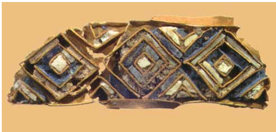
משמאל: שבר תכשיט זהב משובץ מתקופת הברונזה המאוחרת, תל לכיש (שכבה VI) למטה: שבר קערה ועליו כתובת בכתב כנעני מתקופת הברונזה המאוחרת, תל לכיש