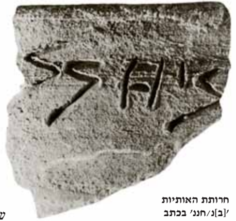
חרותת האותיות א'ב/נחננ' בכתב פרוטו-כנעני על שבר קערה, המאה העשירית לפסה"ג, תל בטש

גדולים מאוד, ולמעט מילים אחדות הכתובת נשארה בלתי מובנת, כך שהבסיס לקביעת הניב צר מאוד. טענת חוקרים שהכתובת כתובה עברית מסופקת ביותר, 64 ושכתוב אותיות האלף-בית ופענוח הכתובת הקדומה הזאת כאילו הייתה טקסט בעברית מקראית של סוף ימי הבית הראשון רחוקים מן הדעת. 65 יש לזכור שמרבית המתנחלים בחבלי ההר בתקופת הברזל א מוצאם היה מכנען (חבלי הספר היו כמובן חלק מכנען), וכי הלשון העברית צמחה מהלשון הכנענית. מפליא הדבר שהחוקרים שדנו בכתובת לא שקלו את האפשרות שהפעלים ושמות העצם המופיעים בכתובת, והידועים מהשפה העברית, משקפים את הדיאלקט הכנעני שממנו צמחה והתפתחה העברית. נותר רק לקוות שפרסומים שיופיעו בעתיד ישפכו אור נוסף על לשון הכתובת ועל תוכנה.