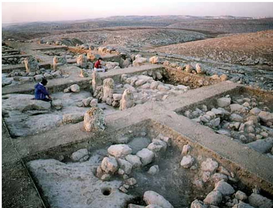
שרידי יישוב מבוצר בח'רבת א־דוארה, מצפון לירושלים

המבנים נבנו צמוד לחומה ומרכז האתר נשאר ריק, כמו בח'רבת קיאפה, ודומה שכך היה גם בח'רבת אלמדינה אלמערג'ה. 49