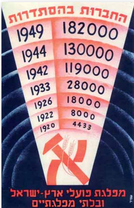
הגידול בחברי ההסתדרות בכרת בחירות של מפא"י

עוד במהלך שנות השלושים, איגד בתוכו מספר ארגונים והתארגנויות כלכליות של בני המושבות הוותיקות (אנשי העלייה הראשונה) ובני העיר (אנשי מעמד הביניים). האיחוד האזרחי מיזג בתוכו גם את 'התאחדות האיכרים', שאיגדה פרדסנים, כורמים, בעלי מטעי שקדים, עובדי פלחה ומספר