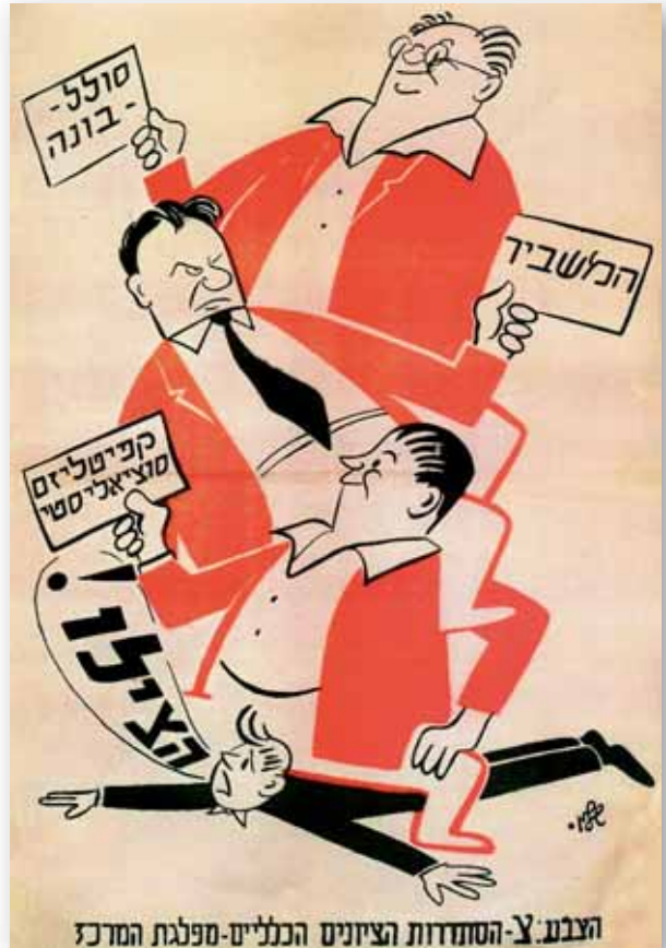
העבע-צ-הסתדרות הציונים הכלליים-מפלגת המרכז

שתיים מהסיבות העיקריות לכישלון המחנה האזרחי להפוך למחנה הדומיננטי בתקופת היישוב היו תהליך ההתגבשות הלקוי של המחנה והעובדה שמנהיגיו עסקו בפעילות ציבורית על חשבון עסקיהם הפרטיים או חברותם בגופים כלכליים. ראשית, תהליך המיסוד של המפלגות האזרחיות היה אטי בהרבה מזה של מפלגות הפועלים, ובמשך רוב שנות העשרים היו מפלגות אלה לא יותר מאשר התארגנויות אד-הוק לצורכי בחירות (כדוגמת המפלגות שהוקמו לצורכי הבחירות לעיריית תל-אביב או נציגי ה'ציונים הכלליים' בוועד