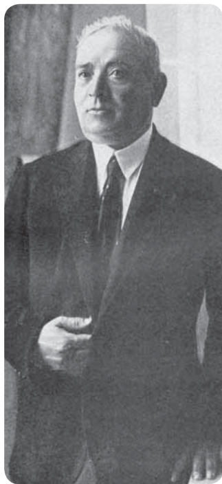
מאיר דיזנגוף (1861-1936)

המושג 'ציונות כללית' מורכב מעט. מפלגת 'ציונים כלליים' איחדה בתוכה שני זרמים שונים בזרם המכונה 'ציונות כללית': הזרם ה'עולמי' והזרם ה'ארץ-ישראלי'. על אף שמם הזהה, 'ציונים כלליים', היו אלו שני זרמים שונים, שהתגבשו בנפרד וללא כל קשר ביניהם, ועל כן לא היו להם בתחילה נקודות מפגש. הזרם ה'עולמי' מקורו בהסתדרות הציונית העולמית. זרם זה התמקד בפעילות להשגת המטרה העליונה של העם והתנועה הציונית – 'תכנית בזל'. סיעת 'ציונים כלליים' הייתה הסיעה הגדולה ביותר בהסתדרות הציונית עד הופעת ה'ארגונים המיוחדים', שהופיעו על כמת ההסתדרות הציונית החל מ-1907 וכללו חוגים דתיים או פועליים בעלי השקפות ייחודיות בתחומי הדת או החברה. אך