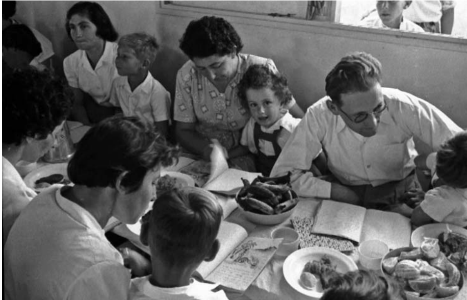
סדר פסח באחד מקיבוצי עמק הירדן, שנות הארבעים