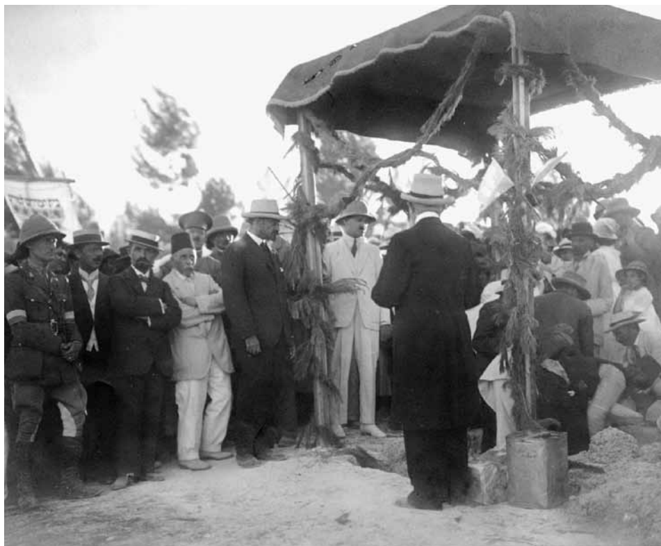
הנחת אבני הפינה לאוניברסיטה העברית בהר הצופים בירושלים, יולי 1918

מציאות. ועד הצירים בראשותו של ויצמן ראה בהנחת אבני פינה לאוניברסיטה, שהייתה למוסד של התנועה הציונית, הזדמנות לבחון את מידת הרצינות של השלטון הבריטי לפעול למימוש הצהרת בלפור. עד מהרה התברר כי יש פער בין המדיניות של הכוחות בעיר להצהרות הפוליטיות, כפי שמציינת יעקובסון בקשר למקרים אחרים. רק לאחר מאמצים גדולים הצליחו אנשי התנועה הציונית לשכנע את הבריטים לאפשר את קיומו של הטקס, והיה זה ניצחון לתנועה הציונית. הייתה זו גם דוגמה לאפשרויות האופייניות לתקופת מעבר: בתקופת מעבר נוצרות הזדמנויות, ומי שמשכיל להבין את המציאות מצליח לנצלן לטובתו. התנועה הציונית הצליחה בעניין זה משום שהיו לה חזון (שנשא ויצמן), אנשי מעשה (למשל מרדכי בן