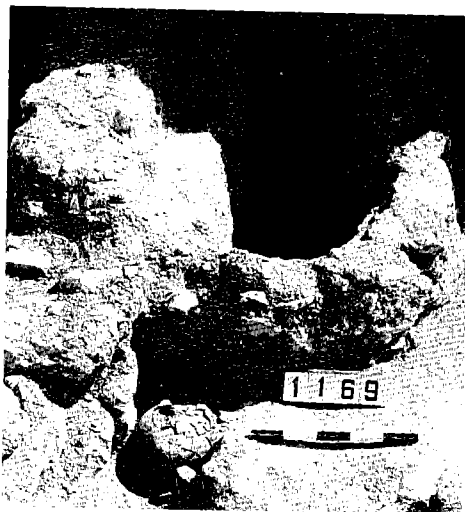
איור 2 (מימין): אגן מים בחדר 1134 איור 3 (משמאל): אגן מים בחדר 1169 סמוך לגיליון

שביל הנחש, שבו נמצאה מגילת בן סירא (תחנה 26 במסלול הסיור בהר). מימין לפתח הכניסה לסוגר ומעבר לקיר החדר הצמוד לו (חדר 1169) ניתן היום להבחין בחלקו התחתון של אגן מים, ששטחו כ-55x110 ס"מ, ואשר בעת החפירות היה מצב השתמרותו טוב יותר (איורים 3 ו-4). בסוגר 1141, שבחומה הדרומית-המזרחית, נבנו שלושה אגנים צמודים זה לזה, שהמרכזי שביניהם נהרס עוד בימי הקנאים. שטח אחד מהם 55x110 ס"מ.