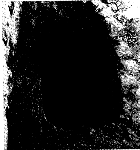
איור 1: אגן מים בחדר 208

למטרות האחרות שנוכרו לעיל ניתן היה להשתמש במים שנשמרו בכל דרך, אולם טבילת הידיים חייבת הייתה להיעשות דווקא במקווה כשר. לפיכך מתקבל על הדעת שלפחות חלק מאגני מים אלה - אלו שכמות המים שהכילו גדולה מהכמות הנדרשת למקווה - אכן שימשו מקוואות לטבילת ידיים. אף שכמה מהאגנים נהרסו ולא ידוע עומקם המקורי, הרי ממדיהם הקיימים מעידים על כי רבים מהם יכולים היו להכיל מעל ארבעים הסאה הנדרשים למקווה (כ־332 ליטרים לפי הדעות השכיחות על שיעורן של האמה והסאה).