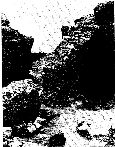
איור 5: אגן המים בחדר 1194

הסבר זה הסתפקו במפלס הנמוך של המקווה מכיוון שכל ייעודו היה לטבילת ידיים. ואולם המקוואות לטבילת ידיים שנמצאו בירושלים,