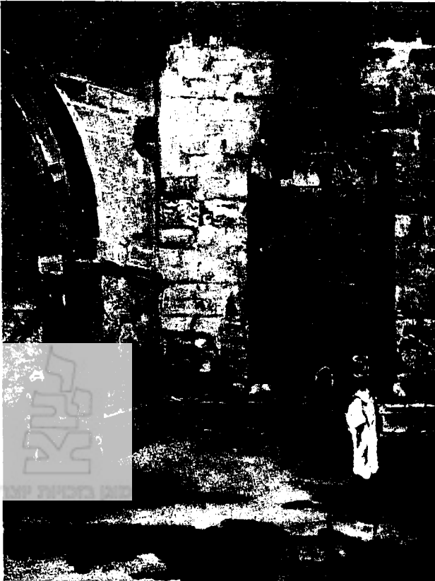
הכניסה לסראייה בירושלים העתיקה