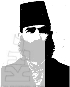
פא'י אפנדי, מושל בית-לחם (1904)

בשנתונים מכאן ואילך, כולל בית-לחם, ראמאללה, צ'פא וע'ב'ין בנפת ירושלים, רמלה, נ'ע'לין, מג'ד'ל, פ'אלוג'ה וח'אן יונס בעזה וב'ית א'עט'אב (ב'ית עט'אב) וב'ית ג'ב'רין בחברון. רוב הנאחיות הללו לא היו למעשה חדשות אולם מעמדן כנראה 'מוסד' עתה, וזאת משום שהממשלה שאפה ליישם את החוק ביתר יעילות ולהרחיב את שליטתה בכל המחוז. בהתאם למדיניותו הפעילה והמקרבת של הסלטאן עבד אלחמיד כלפי הבדווים ונוודים אחרים שהוא ביקש לשלב במדינה, נרשמו באותה עת גם מספר שבטים כיחידות מנהליות בפני עצמן. 34 מספר נאחיות חדשות שנוצרו בשנת 1908, כולל