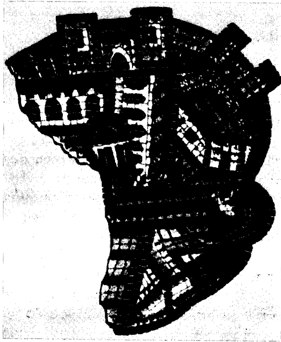
ניאפוליס במפת מירבא; ייתכן שחצי-העיגול מצד ימין מתאר תיאטרון