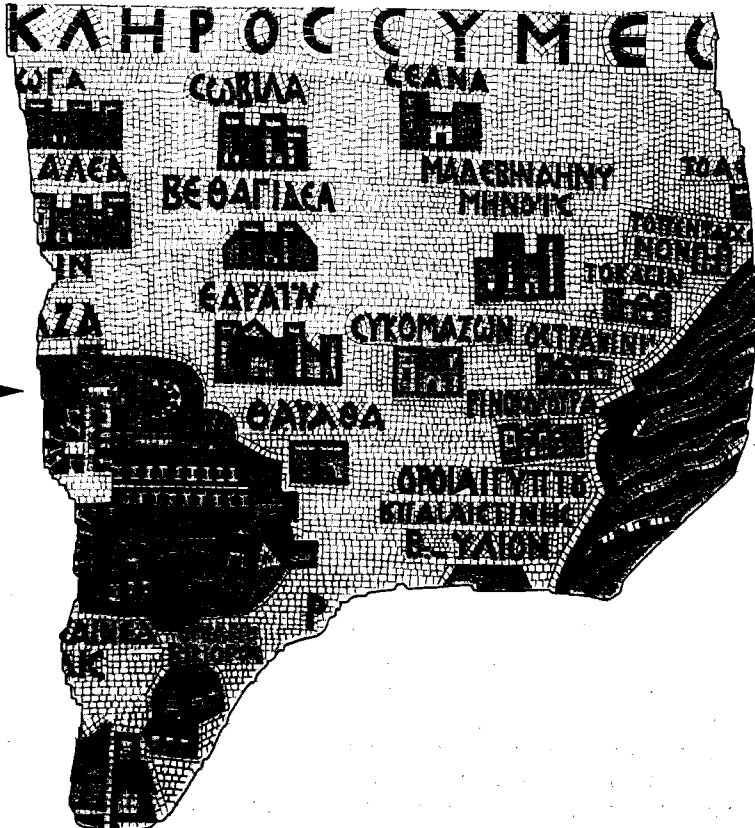
עזה במפת מירבא; ייתכן שחצי-העיגול בחלק הימני העליון של העיר מתאר תיאטרון