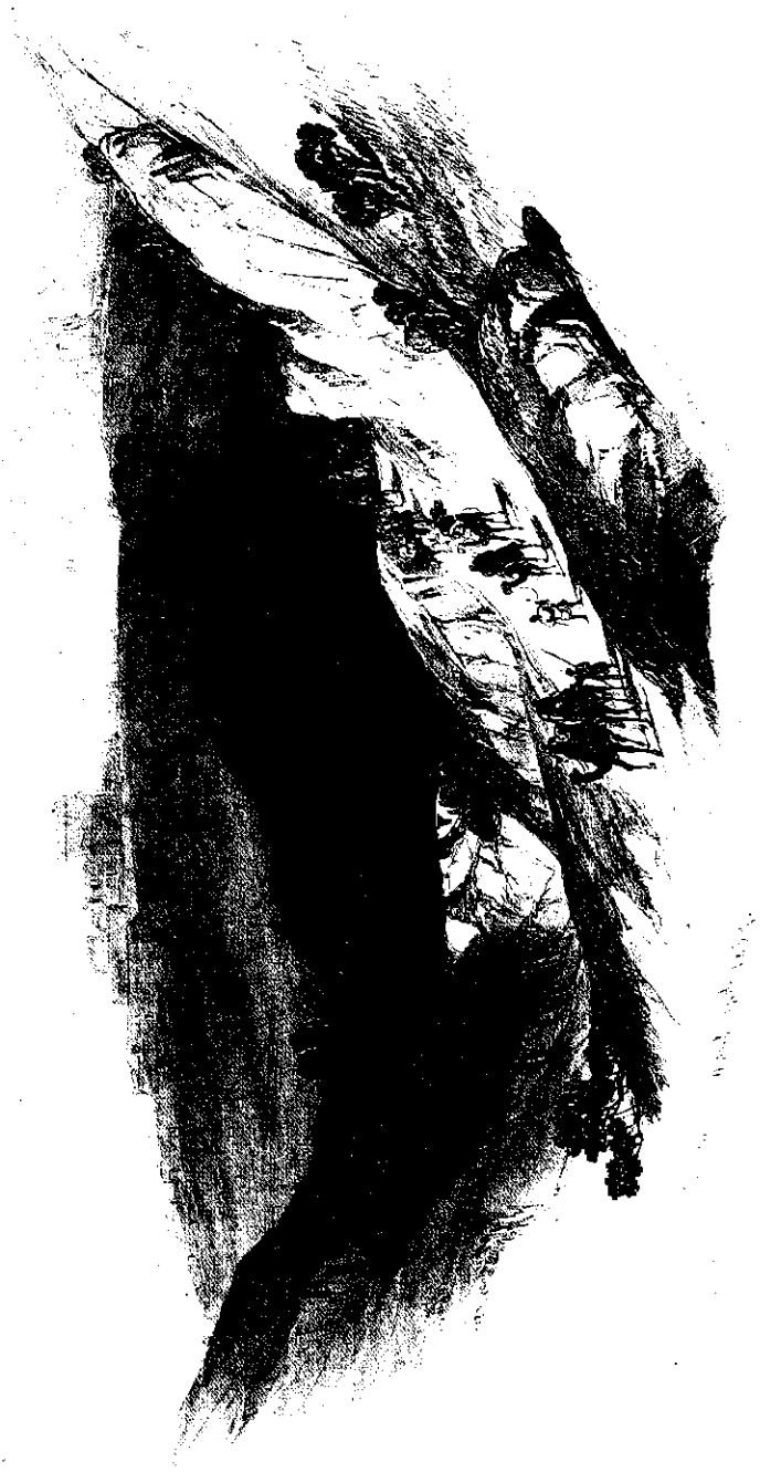
סמוע — ציור של היוודי דוברטס (1839)