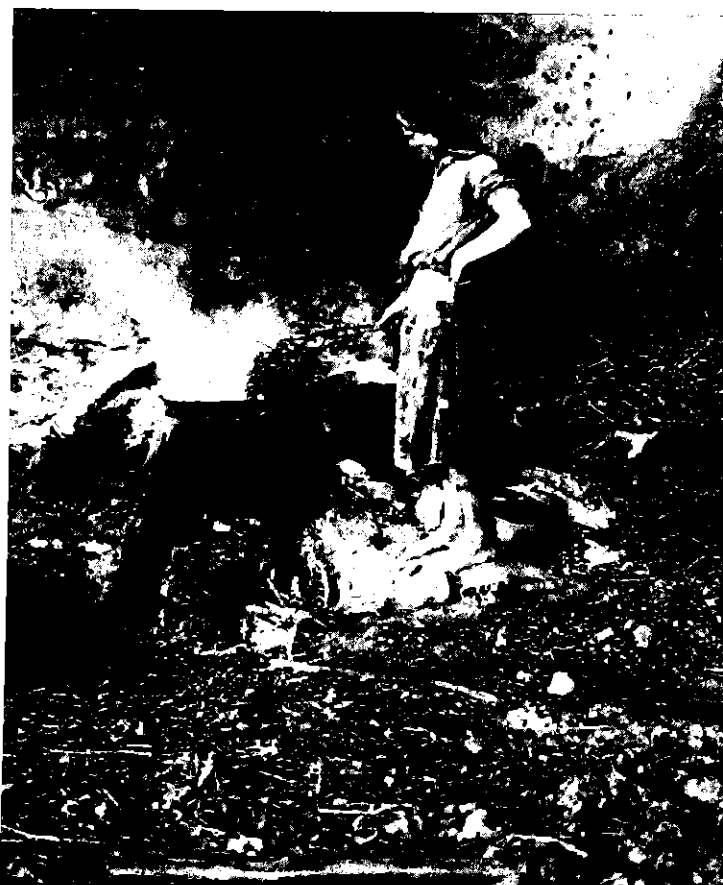
למעלה: העשיית זכוכית בויתית בחברון. משמאל: ייצור אבקת שריפה במערות בית גוברין