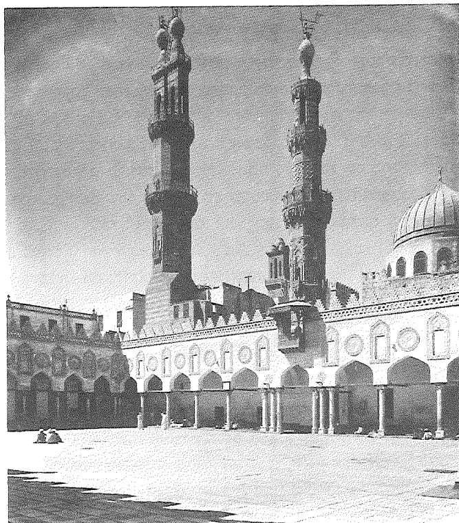
רחבה במסגד אל-אזהר, קאהיר, שנת 969/73

המשפחה מפאס 6 המשפחה היתה אמידה, כפי שמשמע ממכתבים אחדים, ועסקה במסחר. האב כאמור היה סוחר בארגמן ובניו עסקו כנראה בסחר בשמים, כמו שעולה מרשימה מסחרית הרשומה על צידו השני של מכתב שקיבלו האחים מאברהם בן הגאון. ברשימה נזכרים שני בקבוקים של מי ורדים 7 . שלושת האחים הללו, בעיקר אברהם, מתוארים בספרות המחקר בתור 'משפחת