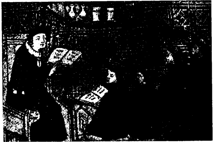
תלמידים ומורה, כתב־יד מן המאה הי"ג

ידי אנשי מוסר ונאמני אלוהים, ויתר על כן על־ידי כאלה שהינם ראויים להימצא בקרבת האלוהים. 27