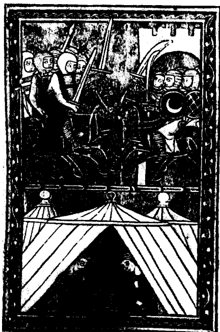
מבילויי הזמן של האצולה הצלבנית: קרבות ומשחקי-שחמט. מתוך 'תולדות ממלכת הצלבנים', כתבי-יד מן המאה ה-13

(Pierre Dubois) — היה השליט שתוארו 'מלך-לוחם' (bellator rex). לדעתו של רנון לול, 'מלך-לוחם' זה ייבחר על-ידי האפיפיור ומעמדו יהיה כעין וסאל אפיפיורי המחזיק את ממלכתו כפיאודום, כלומר כנחלה פיאודלית, מהכס הקדוש. 7 תלות שכזו של השליט באפיפיור לא התקבלה על דעתו של פייר דיבוא, סוכנו ותומכו הנלהב של פיליפ הרביעי 'היפה', מלך צרפת. דיבוא, אשר הונחה בטוויית תכניותיו המדיניות על-ידי ההנחה לפיה 'כל העולם חייב להשתתף ולהיות כפוף לממלכת צרפת', 8 דרש כי השליט יהיה בן חסותו של מלך צרפת. לכן, בעוד שלול גרס כי המלך-לוחם ייבחר, עמד דיבוא על כך שמישרה זו תעבור בירושה בתוך משפחת המלוכה של צרפת. 9