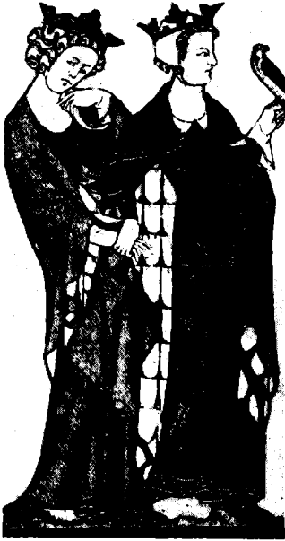
זוג אצילים מן המאה הי"ג במיטב לבושם. על זרועו של הגבר בו ציידים. ציור מן המאה הי"ג

למעמד השליט בממלכה. כמו הממלכה הצלבנית ההיסטורית, הממלכה החדשה אמורה היתה אפוא להיות מדינה קולוניאלית. 3 אופיה הקולוניאלי של הממלכה החדשה — על החלוקה המסורתית, ואפילו הפרדה, בין ה'כובשים' וה'נכבשים', 'שליטים' ו'נשלטים' — מסביר מדוע המלצותיהם של התיאורטיקנים התרכזו כולן במעמד הכובשים ומדוע אין הן אלא בחינת רפורמה של מוסדות הממלכה ההיסטורית, ולא הגיעו לידי תכנון מדינה חדשה לחלוטין. כך התמקדו ההמלצות של התיאורטיקנים כשטחים בהם ראו צורך לערוך רפורמה: מימשל ומישטר, הגנה ובטחון, קולוניזאציה וחינוך.