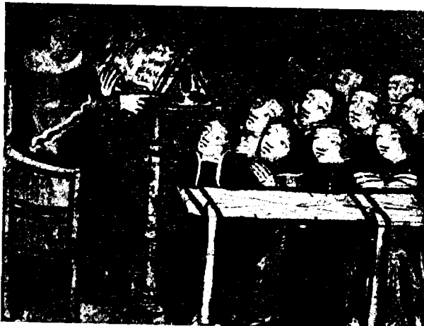
תלמידי בית-ספר לרפואה, כתבי-יד מן המאה ה-11