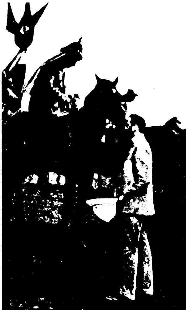
פגישתם של הרצל ווילהלם השני בשעריה של מקוה-ישראל, 1898 (תמונה משוחזרת)

ויהיה לו משקל מיוחד בארץ-ישראל. עובדה זו חשובה היתה לגרמניה כשל זיקתם החזקה של היהודים אליה. טְרוֹמְלֶר סבר שְׂדֵי אם תהיה התנגשות בין-עדתית בין ערבים ויהודים – יקבל היישוב ברצון את חסות גרמניה. הוא הסיק כי –