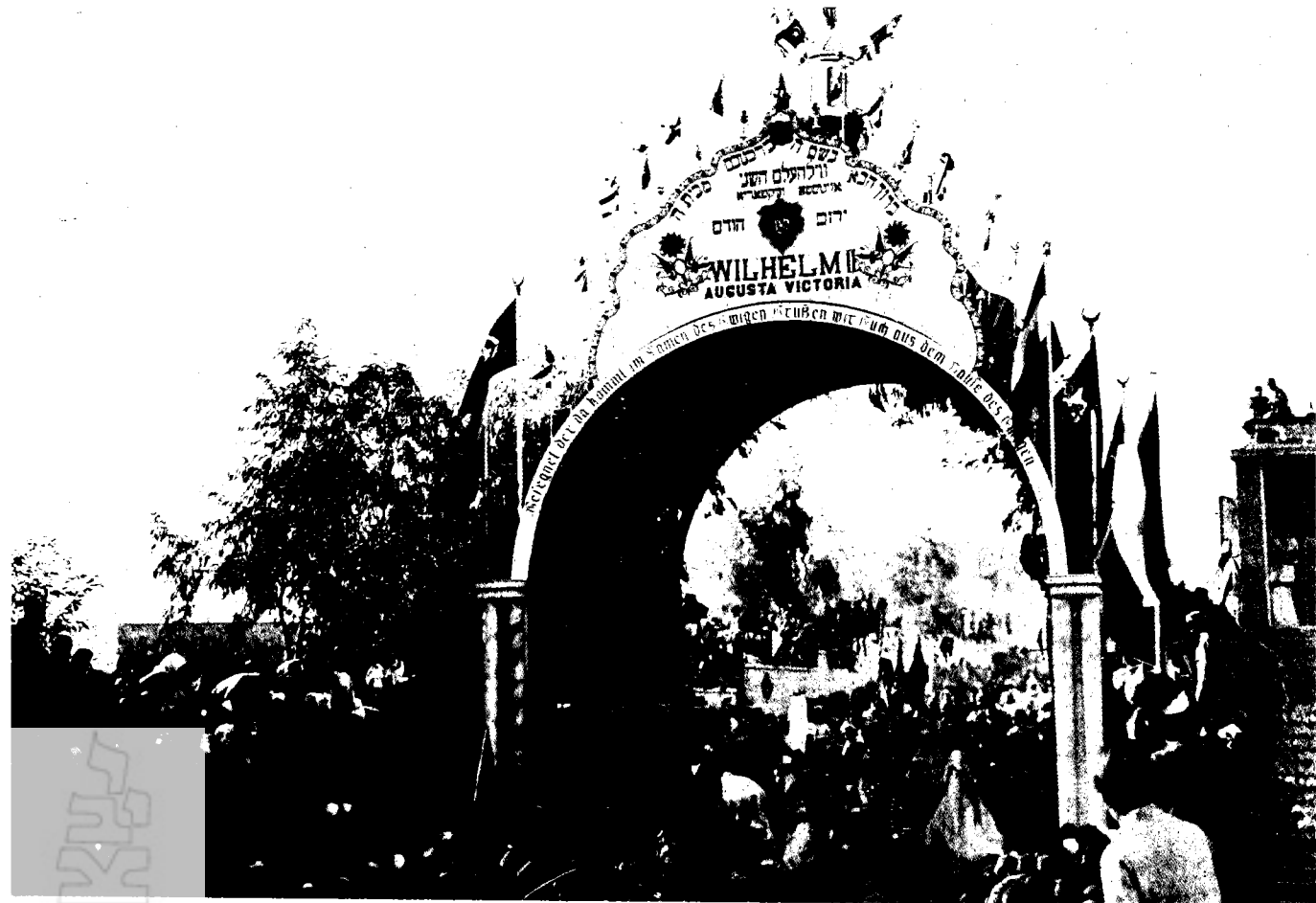
קשת-ניצחון שהוקמה בירושלים לכבוד ביקורו של הקיסר וילהלם השני, 1898

את הנימוקים המוסריים האלה חיזק הקיסר בטיעונים של תועלת: