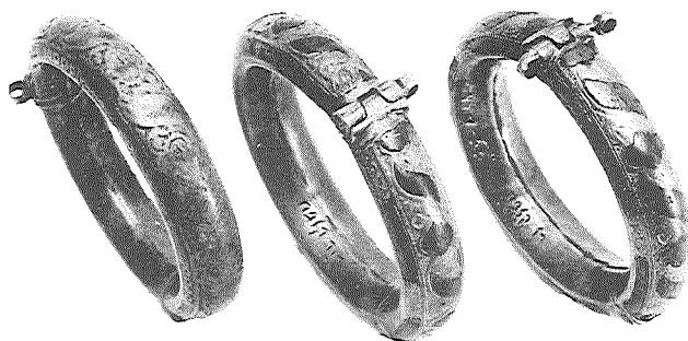
תמונה 3: צמידי ניילו (מאוסף מוזיאון ישראל בירושלים). מספריהם, מימין לשמאל M94-1-55, 102/43, 2039(507). תמונה 4: חתימת האומן בצמיד מס' (507) 2039 באוסף מוזיאון ישראל, ירושלים.