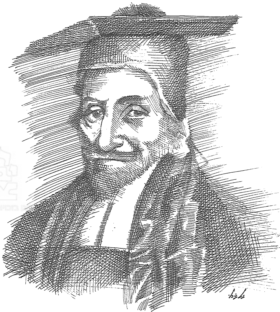
אדורד פוקוק (1604-1691)