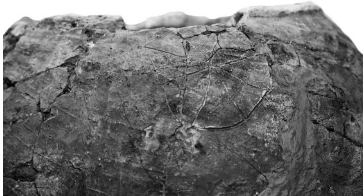
איור 4: סימון על דופן התנור