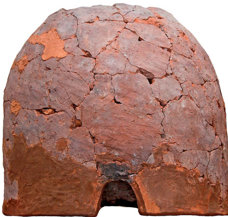
איור 2 (למעלה): התנור מתל רחוב לאחר שחזורו במכון לארכאולוגיה באוניברסיטה העברית בירושלים איור 3 (למטה): התנור מתל רחוב, שרטוט חתך