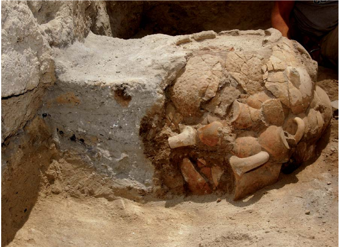
איור 1: תצלום התנור מתל רחוב בעת החפירה, שימו לב לציפוי כלי החרס ולערמת האפר מצד שמאל

אלא ככל הנראה רק זרדים וענפים דקים. אכן בתחתית התנור נמצאה שכבת זרדים מפוחמים, ובתוכם שפה של סיר בישול. חשפנו את התנור כשלדפנותיו מוצמדים מבחוץ שברים גדולים של כלי חרס, שחלקם ניתנים לרפאות. אלו היו חלקי פכים, קנקנים וסירי בישול, רבים מהם מחופים בחיפוי בצבע אדום האופייני לתקופה זו. חלקי הכלים הוצמדו לתנור בצפיפות רבה בעזרת טיץ, באופן ובצורה שאין אנו מכירים מן התנורים האחרים שנחשפו בחפירות תל רחוב, ושמרבתם השתמרו רק בחלקם התחתון. בצדו הדרומי-מזרחי של דופן התנור, הצד הפונה לחצר, מתחת לשפה, נחרט בזמן הבנייה בעזרת כלי חד סימן דמוי ורדה ובו ארבעה קווים חוצים המחלקים עיגול לשמונה גורות (איור 4). אין אנו מכירים סימן כזה בתנורים אחרים מתקופת הברזל, וייתכן כי זהו סימן בעלות או סימן של בנאי/ת התנור. יש לציין שסימן זה לא נראה לעיץ בזמן השימוש בתנור, מכיוון שהיה מכוסה בשכבת החרסים שתוארה לעיל. על קרקעית התנור נמצאו שרידי ענפים מפוחמים ופחם, ומחוץ לו, בינו לבין קיר הלבנים שמצפון לו, נמצאה ערמת אפר אפור בהיר שגובהה כגובה התנור. סמוך לתנור נמצאו שתי אבני רכב של מערכת אבני שחיקה ששימשו לטחינה, וכן מכתש אבן.