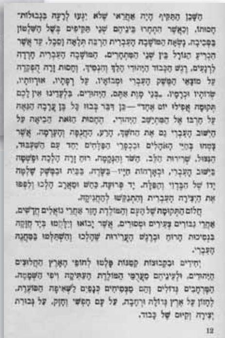
פרסום של עבר-הדני (א' פלדמן) במסגרת 'ספרית ארץ-ישראל' של 'קרן קימת לישראל' שיועדה לנוער, וקטע מתוכו

מכירתן המוצלחת של שתי המהדורות הראשונות הייתה ביטוי להלך הרוח ששרר ביישוב בשלהי שנות השלושים. ההדפסות החוזרות ונשנות של הקובץ מלמדות כי התממשה תקוות המוציאים לאור ש'הקובץ ימצא את דרכו כראוי לו אל הקורא העברי ואל מחנות הנוער החלוצי בארץ ובתפוצות, והיה לספר עם, מאיר נתיבות ומכשיר חינוכי להמשך קו הכיבוש, היצירה וההגנה בארץ'. 7 הימים היו ימי המרד הערבי, והיישוב היה נתון בעיצומו של מאבק על ארץ-ישראל. העימות בין היישוב היהודי לבין האוכלוסייה הערבית הלך והחריף, וסיפורה של ראשית ההגנה העצמית בארץ-ישראל מפי דור המייסדים שיקף נאמנה את מאורעות העבר אך גם סיפק צרכים נפשיים של בני היישוב בתקופת