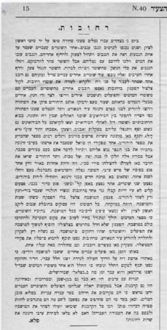
עדות על 'תקרית זרנוגה' בקטע מתוך 'הפועל הצעיר', כ' בתמוז תרע"ג

על פי עדותו של ספקטור תחילתו של אותו מאורע הייתה בשיירת גמלים שעברה בסמוך למושבה, ושאחדים מאנשיה נכנסו לכרמים על מנת לגנוב ענבים. כאשר ניגש אליהם השומר ואיים עליהם במקלו שלא יעזו לקחת את אשר לא להם לעגו לו הערבים והמשיכו בשלהם. בשלב זה שלף השומר את אקדחו ואיים עליהם, אך תוצאות מעשהו היו הפוכות ממה שציפה. הערבים הקיפוהו, התנפלו עליו, גזלו ממנו את נשקו וברחו עם גמליהם מהמושבה. לאחר שהשומר המושפל סיפר את קורותיו בכרם עלה ספקטור על סוסו ורדף אחרי השיירה. כאשר השיגם ביקש מהם להחזיר את האקדח שלקחו אך בקשתו נפלה על אוזניים אטומות. אנשי השיירה הקיפו גם אותם, איימו עליו במקלות, ואחד מאנשי השיירה, 'בחור חסון ורחב כתפיים, הוציא את האקדוח מתחת לבגדו' כיוון אותו אל ספקטור ואמר 'אם אתה רוצה את האקדוח, בוא, התקרב ותקח אותו. הכדור הראשון יפגע בסוסה – והשני בכך'. ספקטור נסוג לאחור ודהר למושבה להביא תגבורת. למרדף השני הצטרפו ארבעה רוכבים, והם השיגו את שיירת הגמלים ליד נס־ציונה. החמישה הקיפו את הערבי