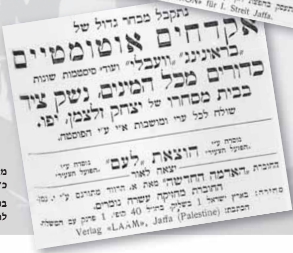
מודעות מתוך 'הפועל הצעיר', כ' בתמוז תרע"ג ברקע: פרט מתוך קובץ 'יזכור' לחללי 'השומר', ניו-יורק תרע"ז

כאשר הקימה מניה שוחט במקום בשלהי 1907 את הקולקטיב וקיבלה את אישורו של מנהל החווה, אליהו קראוזה, לנהל את עבודת הפלחה. התנאי המרכזי בהסכם היה שמשק הפלחה יימסר לפועלים, ושהם ינהלוהו באופן עצמאי ויקבלו מחצית מהרווח הנקי. משנודע לישראל שוחט, אשר שהה באותה העת ביפו, דבר ההסכם הוא החל לשלוח לחווה את חברי 'בר גיורא', והם הגיעו למקום זה אחר זה