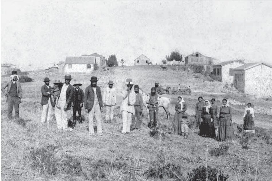
הבילויים בגדרה, תרנ"א

התזה של הספר מעוררת שאלה מעניינת שאיננה נדונה בו: מדוע הושתקה תרומת היישוב הוותיק בתולדות יצירתה של התרבות העברית בארץ? כיצד הצליחו אנשי העלייה השנייה לכתוב נרטיב היסטורי שבו ניכסו לעצמם את הישגיו של היישוב הוותיק והדחיקו את סיפור מאבקיו? עם כל זאת אין בהערותי כדי להוריד מערכו של הספר, ואני מבקשת לחזור ולהדגיש את חשיבותו של הספר גם מבחינת התזה שהוא מציג וגם מבחינת המתודה שבה הוא מאשש אותה.