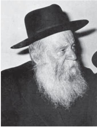
הרב צבי יהודה הכהן קוק (1891-1982), ראש ישיבת מרכז הרב

חברי האגודה טענו כי ישיבת 'מרכז הרב' לא נתנה פתרון להבדלי הרמות בין התלמידים מחו"ל ולא השכילה להשלים את הפער שבינם לבין תלמידי הישיבה. עוד טענו כי למעט שיעורים בתנ"ך ובמחשבת ישראל – שניתנו על ידי מורי הישיבה ותלמידיה, ולא על ידי מומחים מבחוץ – לא עמדה הישיבה בתכנית הלימודים המגוונת, שכללה מקצועות קודש נוסף על גמרא. כמו כן לא מונה מנחה מדריך שיטפל בצורכיהם המיוחדים של התלמידים שבאו מחו"ל. הרב קוק טען לעומת זאת כי האגודה לא עמדה בתנאי ההסכם, מפני ששלחה תלמידים מעטים ועל כן לא הייתה אפשרות לקיים עבורם קבוצות לימוד הומוגניות לפי רמות, והמספר