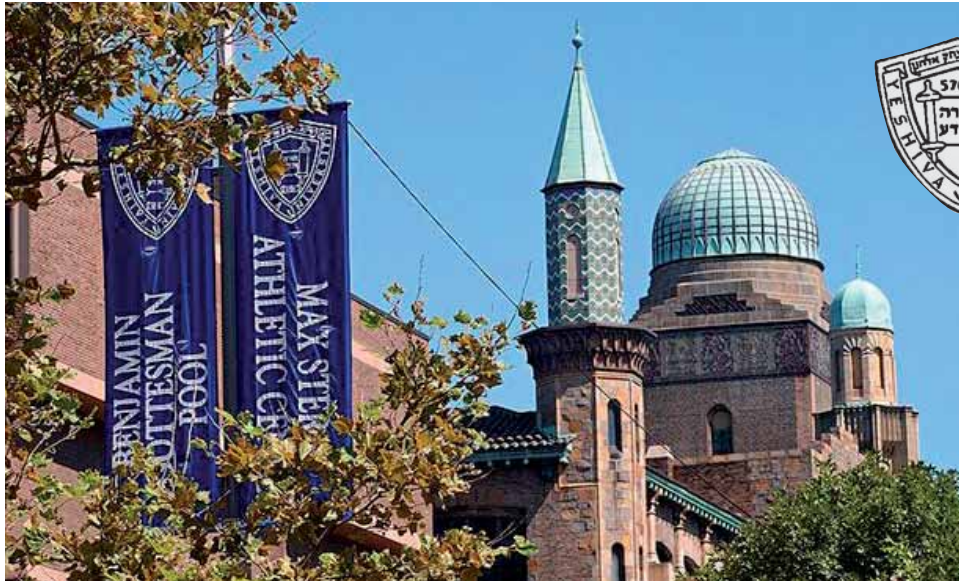
אוניברסיטת ישיבה בניו-יורק; בפינה הימנית העליונה סמל המוסד