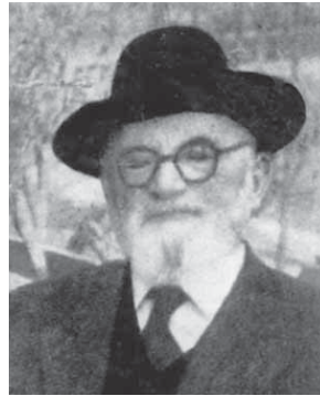
מימין לשמאל: הרבנים יחיאל יעקב ויינברג (1884–1966) ושאול ישראלי (1909–1995)