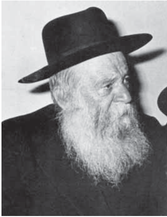
הרב צבי יהודה הכהן קוק (1891-1982), ראש ישיבת מרכז הרב

חברי האגודה טענו כי ישיבת 'מרכז הרב' לא נתנה פתרון להבדלי הרמות בין התלמידים מחו"ל ולא השכילה להשלים את הפער שבינם לבין תלמידי הישיבה. עוד טענו כי למעט שיעורים בתנ"ך ובמחשבת ישראל – שניתנו על ידי מורי הישיבה ותלמידיה, ולא על ידי מומחים מבחוץ – לא עמדה הישיבה בתכנית הלימודים המגוונת, שכללה מקצועות קודש נוסף על גמרא. כמו כן לא מונה מנחה מדריך שיטפל בצורכיהם המיוחדים של התלמידים שבאו מחו"ל. הרב קוק טען לעומת זאת כי האגודה לא עמדה בתנאי ההסכם, מפני ששלחה תלמידים מעטים ועל כן לא הייתה אפשרות לקיים עבורם קבוצות לימוד הומוגניות לפי רמות, והמספר