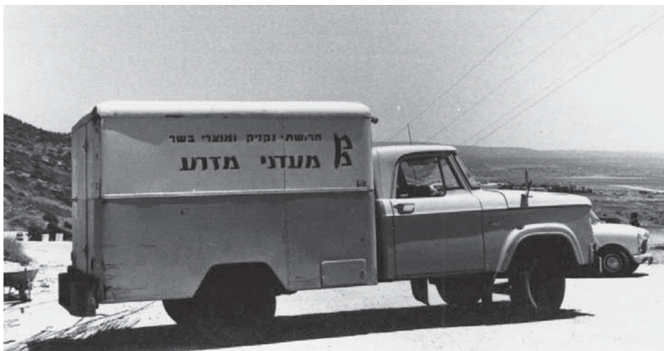
הטנדר החדש של מעדני מזרע, 1963

האתגר לקיבוצים מגדלי החזירים היה התמודדות בשוק שהיו בו תנודות מחירים גדולות, ושפעל על בסיס היצע וביקוש בלבד, בעוד שבשאר שוק התוצרת החקלאית פעלו גם בתום תקופת הצנע מנגנונים לייצוב מחירים – מכסות ומועצות הייצור החקלאיות שהנהיגו רשויות המדינה, ומערכת השיווק השיתופית שהייתה נהוגה בהתיישבות העובדת. 147 הצמיחה המואצת של ענף החזירים הארצי הביאה לעודף היצע ולשפל מחירים גדול בשלהי 1958. זה היה אחד הגורמים העיקריים להתארגנות הקיבוצים לפעולה משותפת, שחלקה הגדול התמקד בניהול הקשרים עם סוחרים הבשר ויצרני הבשר בשוק העירוני. במאי 1961 נמסר בסיפוק גדול למזכירות הארגון ש'המחירים יציבים, המשקים למדו לא למכור מבלי להתייעץ איתנו, והסוחרים יודעים שאין להם הרבה סיכויים לקנות בתנאים שבהם קנו לפני שנים'. 148