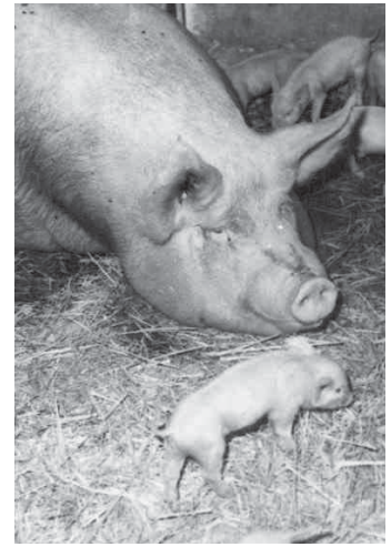
גידול חזירים בקיבוץ עין החורש, 1962