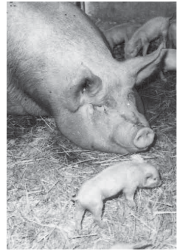
גידול חזירים בקיבוץ עין החורש, 1962