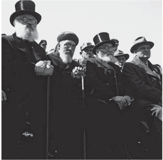
הרבנים הראשיים יצחק הלוי הרצוג (משמאל), בן-ציון מאיר עוזיאל (שני משמאל), והרב איסר יהודה אונטרמן, רבה האשכנזי של תל-אביב (שני מימין) בטקס אזכרה בשער הגיא, 1949

בשנת 1942 הטילה ממשלת המנדט פיקוח על מכירת חזירים חיים לשחיטה והכריזה גם על בשרם כמצרך בר פיקוח, כמו יתר סוגי הבשר. 13 באופן רשמי נשחטו באותה השנה 3,518 חזירים, אבל ברור היה לממשלה ששיעורי השחיטה השחורה של כל סוגי הבהמות גדולים מאוד. 14 למרות ההגבלות היה ענף החזירים הגידול החקלאי שחלה בו הצמיחה המרשימה ביותר מתחילת המלחמה. ההערכה הייתה שהושקעו בו עד 1.5 מיליון לא"י. המחיר של חזירה להמלטה