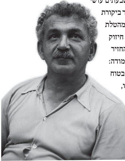
ברל כצנלסון, 1934

הרבנים הראשיים, יצחק הרצוג ובן-ציון מאיר עוזיאל, פרסמו בדצמבר 1943 הצהרה משותפת שקראה לעקור את הנגע ה'מרגיז וממאיר, מביש ומחפיר: נגע גידול החזירים!'. הרבנים הראשיים חזרו על קללה מן התלמוד ש'ארורים, לפיה, מגדלי החזירים בכל מקום שהם [...] וארורים שבעתים עושי התועבה על אדמת הקודש בארץ-ישראל'. 19 איום הרבנים ב'קללת אימים' עורר ביקורת בקרב כותבים אחדים בעיתוני השמאל והציונות הפרוגרסיבית, שהסתייגו מהטלת קללות על ידי רבנים, במיוחד בימי שואה וחורבן. 20 אבל דברי הרבנים קיבלו חיזוק בלתי צפוי מברל כצנלסון, שבטור נרגש בעיתון 'דבר' הזכיר את חלקו של החזיר ברדיפת היהודים מימי היוונים ועד רוסיה של המאה התשע-עשרה וקבע: 'אני מודה: שונא אני חזירים, ויותר משאני שונא חזירים שונא אני מגדלי חזירים [...] בטוח אני בהללו, שאין לך חזירות בעולם שאינם מוכנים ומזומנים לגדל אצלנו, בשביל אותה המטרה הקדושה' – עשיית כסף כמוכן – 'שלמענה הם מגדלים את החזירים עצמם'. 21