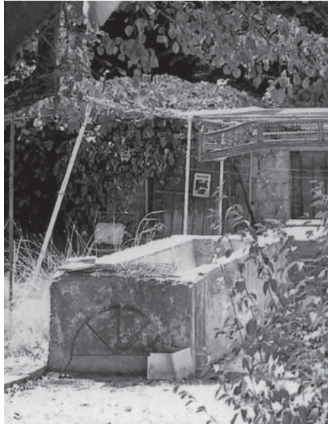
אגנית בנויה ששימשה את הקצב הטמפלרי פרידריך קיבלר בחצר הבית ברחוב כרמיה 8, ירושלים

סוף שנות השלושים. 8 גם יבוא החזירים לגידול או לשחיטה לא עלה על מאות בודדות, לעומת עשרות אלפי ראשי צאן ובקר. 9 למעשה במפקדים הרשמיים של בעלי החיים שערכה ממשלת המנדט בשנות העשרים והשלושים לא נכללו נתונים על חזירים. רמז לנוכחותם ניתן למצוא ב'דוחות על טיפול בבעלי חיים בסעיף 'אחר', הגדרה כללית ששימשה לימים גם את הרשויות במדינת ישראל. 10 המחסור בבשר לאוכלוסייה האזרחית ולצבאות הגדולים שחנו בארץ בזמן מלחמת העולם השנייה הביא לפריחת הענף. חזירים מתרבים מהר הרבה יותר מבקר ומצאן והם יצרני בשר יעילים ביותר, שניתן להאכילם כאמור שאריות מזון. באביב 1942 נספרו לראשונה יותר מ-12,000 חזירים