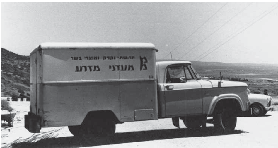
הטנדר החדש של מעדני מזרע, 1963

האתגר לקיבוצים מגדלי החזירים היה התמודדות בשוק שהיו בו תנודות מחירים גדולות, ושפעל על בסיס היצע וביקוש בלבד, בעוד שבשאר שוק התוצרת החקלאית פעלו גם בתום תקופת הצנע מנגנונים לייצוב מחירים – מכסות ומועצות הייצור החקלאיות שהנהיגו רשויות המדינה, ומערכת השיווק השיתופית שהייתה נהוגה בהתיישבות העובדת. 147 הצמיחה המואצת של ענף החזירים הארצי הביאה לעודף היצע ולשפל מחירים גדול בשלהי 1958. זה היה אחד הגורמים העיקריים להתארגנות הקיבוצים לפעולה משותפת, שחלקה הגדול התמקד בניהול הקשרים עם סוחרים הבשר ויצרני הבשר בשוק העירוני. במאי 1961 נמסר בסיפוק גדול למזכירות הארגון ש'המחירים יציבים, המשקים למדו לא למכור מבלי להתייעץ איתנו, והסוחרים יודעים שאין להם הרבה סיכויים לקנות בתנאים שבהם קנו לפני שנים'. 148