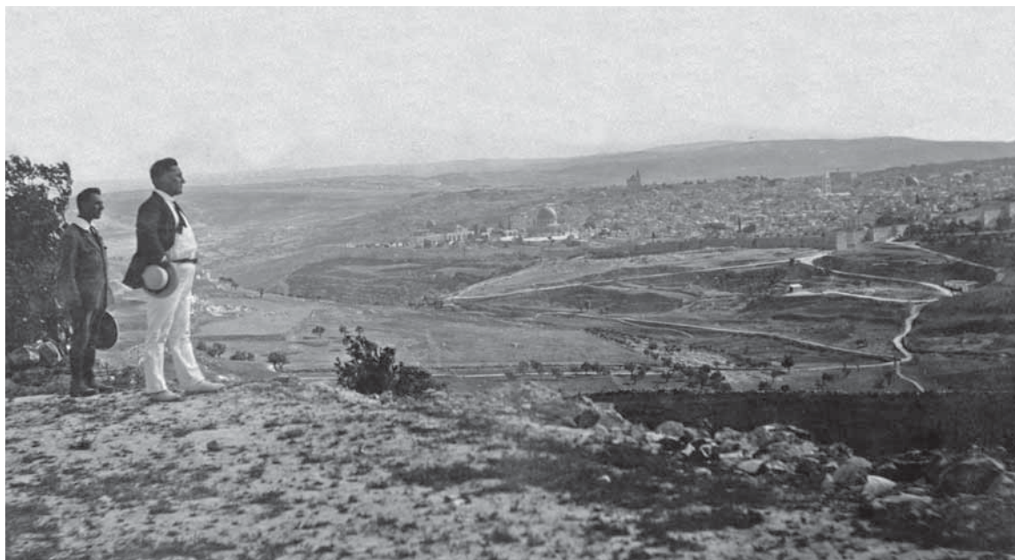
ירושלים, מראה העיר מעל הר הצופים, ינואר 1920

מחקרים רבים נכתבו בשנים האחרונות על האוניברסיטה העברית. ראויים לציון שלושת כרכי 'תולדות האוניברסיטה העברית' 3 וספרו של אורי כהן על האוניברסיטה העברית לפני הקמת המדינה ובשנותיה הראשונות. 4 אולם המחקרים הקיימים לא עסקו בסוגיה הנדונה כאן. המאמר מתבסס רובו ככולו על חומרים שנאספו בארכיון קק"ל וב'ארכיון הציוני המרכזי'. המאמר נחלק לארבעה פרקים: בראשון מסוכם חלקו של כל אחד מן הגורמים שעסקו ברכישת קרקעות האוניברסיטה העברית. בפרק השני מנותחות טענות הצדדים בוויכוח החרף בשאלה על שם מי יש לרשום את הבעלות על הקרקעות ונבחנות פעולותיהם של הצדדים לקידום מאבקם. בפרק השלישי נדונים הניסיונות למציאת פשרה בין העמדות הקוטביות של הצדדים. ובפרק הרביעי נדון חוזה החכירה הייחודי ל-99 שנים שנחתם בין קק"ל לאוניברסיטה ומנותח המשא ומתן שניהלו הצדדים על ניסוח סעיפי החוזה.