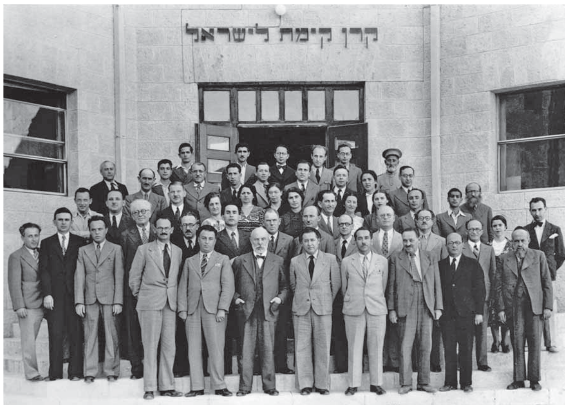
פקידי הקק"ל בראשותו של מנחם אוסישקין, ינואר 1938

ובהם כמוכן האוניברסיטה. 28 תקנון קק"ל וחוזי החכירה של קרקעותיה בעיר ובכפר הבטיחו את שמירת הזהות הציונית על מקרקעין אלו; למשל נאסרה החכרת קרקעות קק"ל ללא יהודים, והחוכרים התחייבו כי הקרקעות יעובדו אך ורק בעבודה עברית. 29