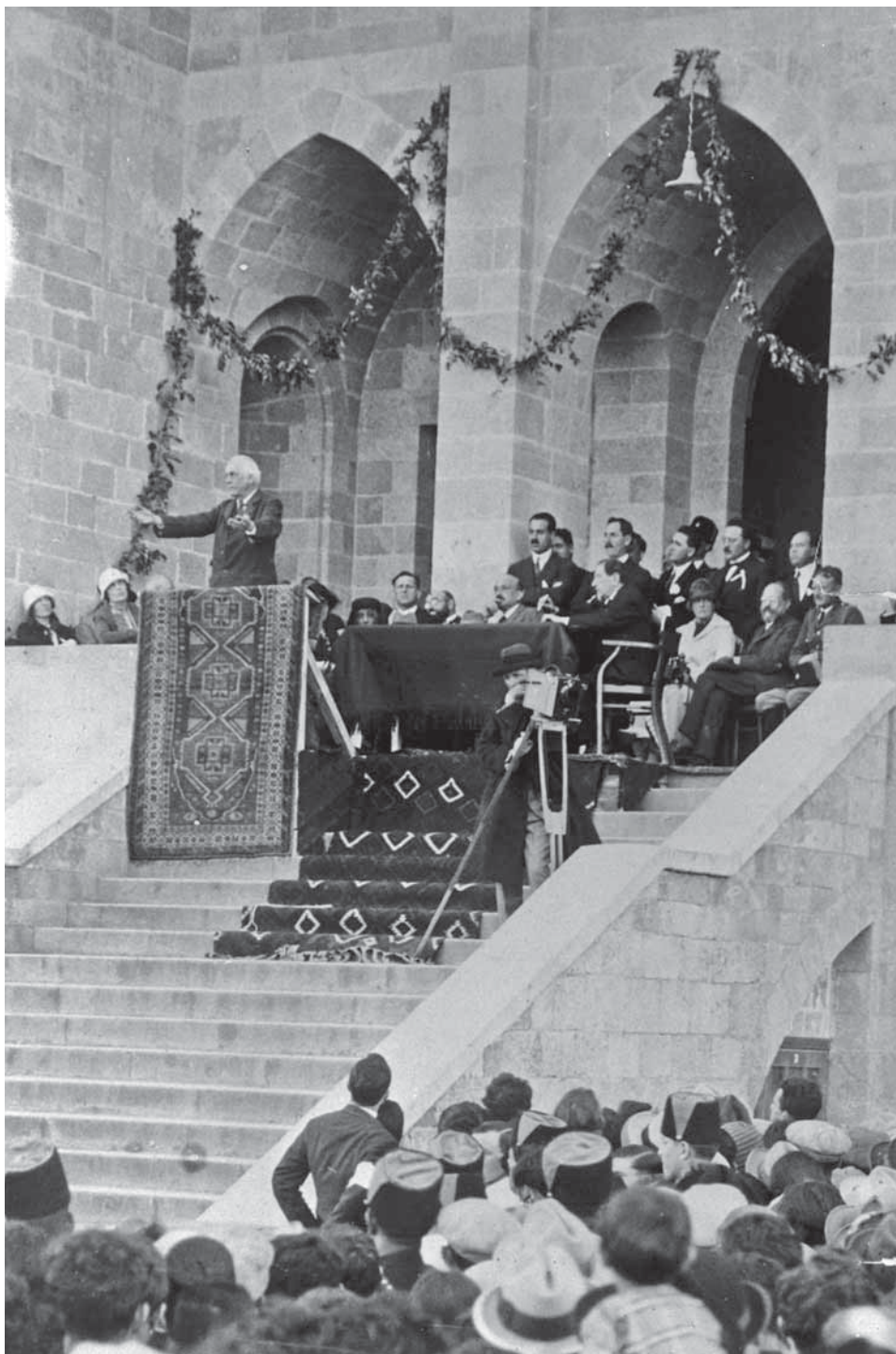
הלורד בלפור נואם בטקס חנוכת האוניברסיטה העברית, 1925