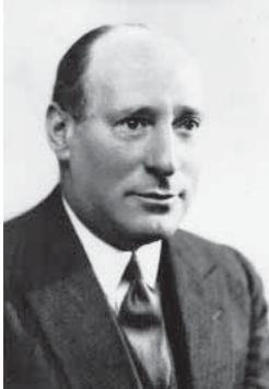
עוזר הארי סאקר

תוכל למשוך את לבו של העולם היהודי, הוא לא יתמוך בה מוסרית וכלכלית, ולא יהיה באפשרותה להשיג האמצעים הדרושים לקיומה ולהפעלתה. זאת ועוד, תורמים פוטנציאליים יהססו לתרום לאוניברסיטה שאיננה הבעלים של נכסיה, אלא חוכרת אותם בלבד, שכן הדבר ייצור את הרושם כי היא נמצאת בקשיים. בניגוד לאוניברסיטאות בעולם, המוכרות לעתים נכסי נדל"ן כדי לממן את פעילותן, האוניברסיטה העברית לא תוכל לעשות זאת מתוקף תקנון קק"ל. ועוד, מלווים לעולם לא יסכימו להלוות לאוניברסיטה שאיננה יכולה להעניק ביטחונות על הלוואות כאלו מפני שהנדל"ן שלה, שהוא בסיס הביטחונות, איננו רשום על שמה. גם קק"ל לא תוכל למשכן את הקרקעות כביטחונות למלווים, שכן הדבר אסור על פי תקנותיה. 45