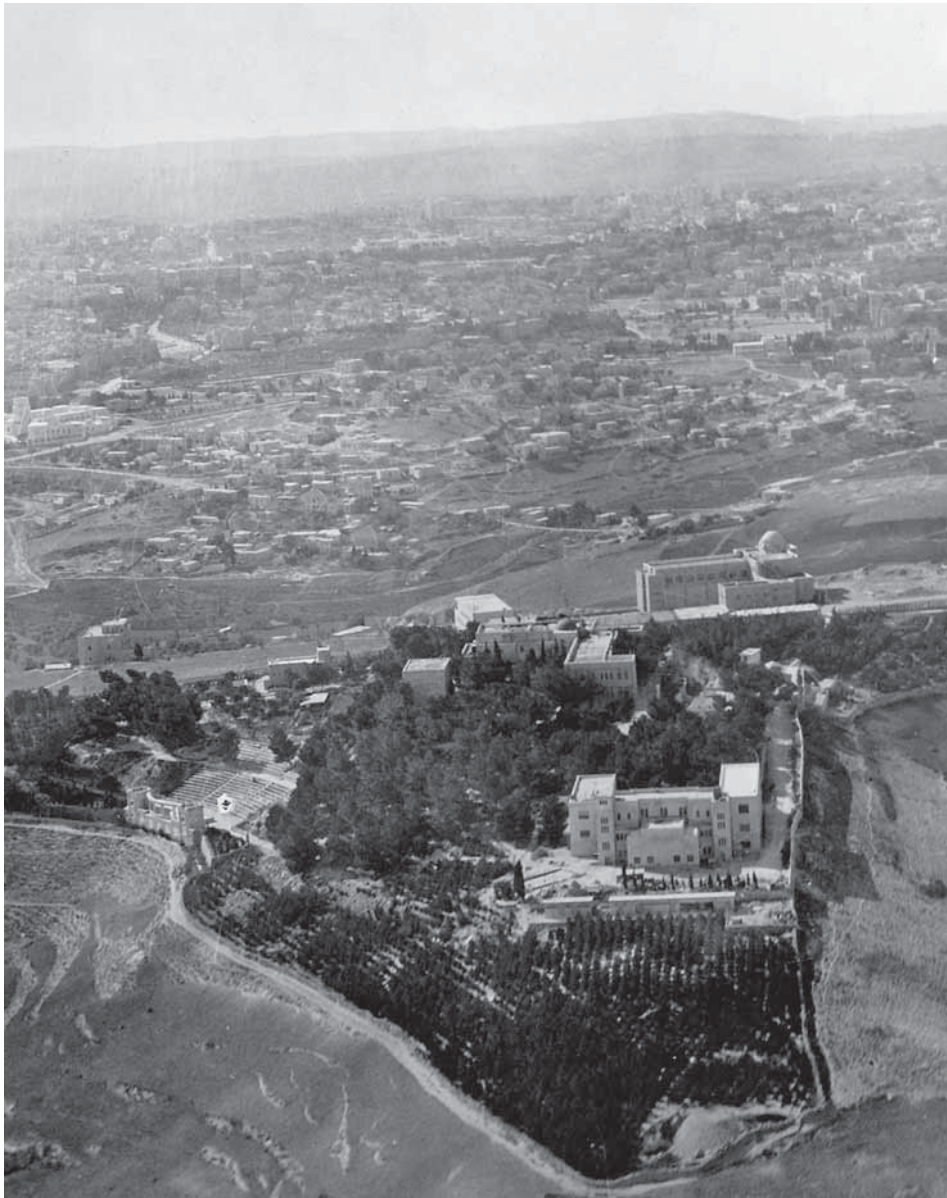
תצלום אוויר של אזור הר הצופים, 1937

ההסתדרות הציונית שבתקנון שלו נקבע – על פי עקרון הקרקע הלאומית ובהיותה באת כוחו של העם היהודי – כי הקרקעות שרכשה עתידות להישאר בידיה לצמיתות. 27 על כן סברה שרק היא תוכל לשמור הן על הקרקעות והן על זהותם הלאומית-הציונית של המוסדות הציבוריים שיוקמו עליהן,