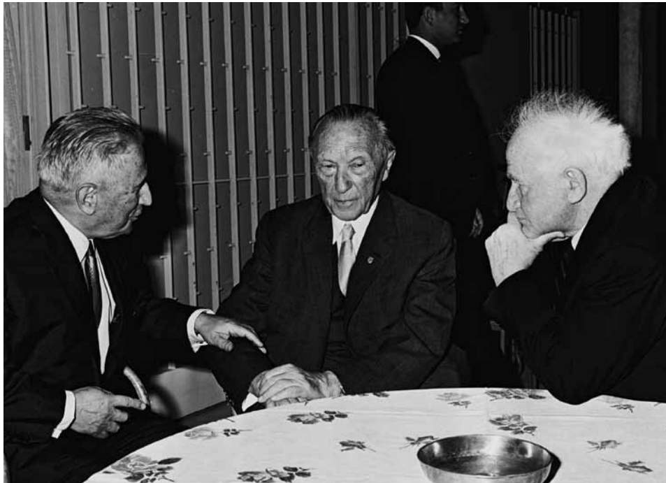
דוד בן-גוריון, קונרד אדנאואר (במרכז) ונחום גולדמן בקבלת פנים בתל-אביב, מאי 1966

שרון לעברו: 'הביטחון הוא לא טובת הנאה או אתנן'. 19 איש מעולם לא העז לומר דברים כאלה למאיר, אפילו בימי שקיעתה, אחרי מלחמת יום הכיפורים. מדוגמאות אלה ניתן להסיק שהמחברת לא הצליחה לצייר את בגין כדמות מורכבת; הוא מוצג בספר בצורה חד-ממדית ואפילו סטראוטיפית.