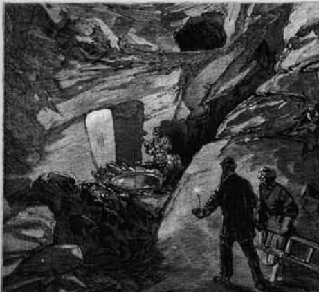
GALLERY AT THE SOUTHEAST CORNER OF HARAM WALL.