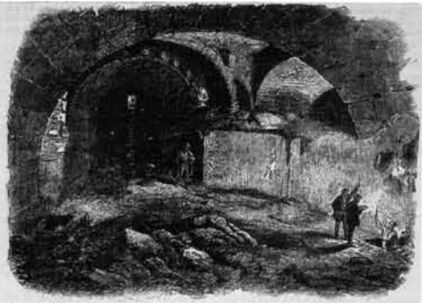
WILSON'S ARCH, HARAM WALL.