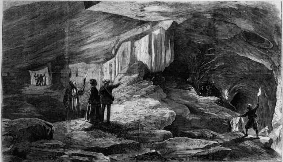
THE ROYAL CAVERNS AT JERUSALEM.