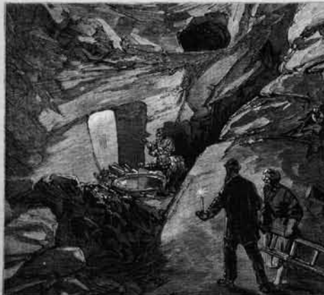
GALLERY AT THE SOUTHEAST CORNER OF HARAM WALL.