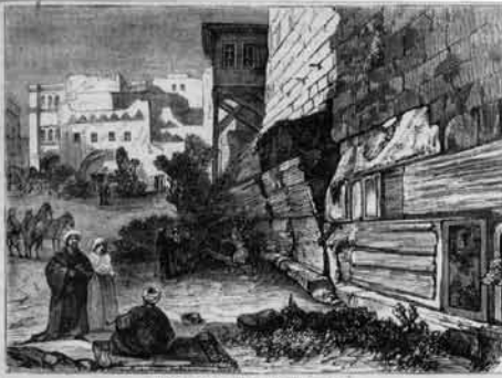
ROBINSON'S ARCH, HARAM WALL.