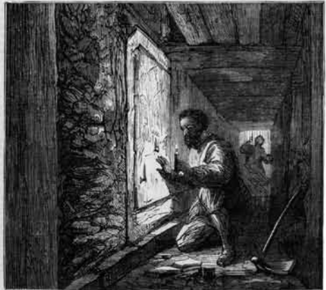
ROCK-CUT TUNNEL NEAR THE FOUNTAIN OF THE VIRGIN.

תיאור חפירותיו של צ'ארלס וורן ב'ירושלים' התת־קרקעית', מתוך השבועון 'Harper's Weekly' על 2 במאי 1869, פי רישומי הצייר ויליאם סימפסון