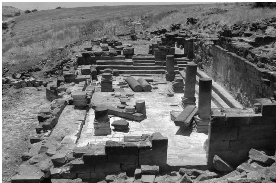
בית הכנסת בדיר עזיז, מבט ממזרח

מאחר של בית הכנסת? ושמה מסתתרים תחתיו שלבים קדומים של אותו בית כנסת? לדוגמה ברוב בתי הכנסת שנחפרו בגליל נמצא שהיו מספר שלבים, ובחלקם הוכח שהמבנים עמדו מאות שנים ועברו שיפוצים יסודיים במרוצת הדורות.