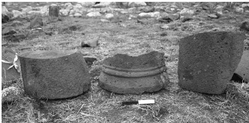
פריטים אדריכליים וספסלים בפנינת בית הכנסת במג'דוליה