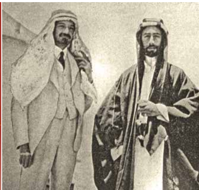
הפתרון הסורי - האמיר פייסל וחיים ויצמן, 1918