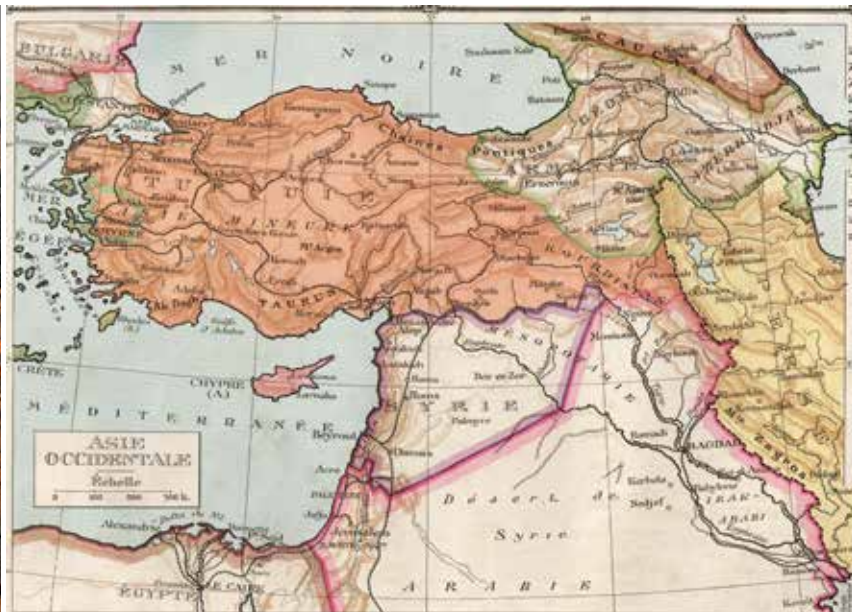
תדמור באור אחר: אדמת יהודים?