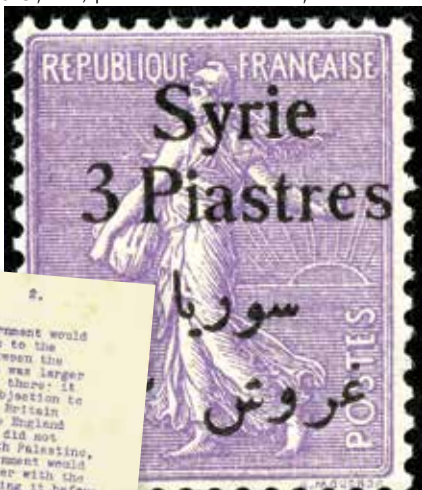
בול המנדט הצרפתי, 1923

דרומה. הוא אינו מצפה שנתיישב לאורך הגבול עם טורקיה אך הציע שלושה אזורים אחרים, חאלב, מָרסין ותדמור (פלמירה). אומנם תדמור היא עתה חרבה אך בעבר היתה מקום פורח וע"י פיתוח השקיה מנחל הפרת אפשר להפריח את האיזור. ז'ובנל אמנם הדגיש כי הוא מדבר בשם עצמו אך הבטיח לקדם את הנושא עם הממשלה בפאריס וביקש שניציג את העניין לפני לורד פלומָר [הנציב העליון הבריטי בארץ ישראל]. הוא מסר לנו כי באיזור תדמור יש אדמות מדינה שניתן להקדישן לפרויקט כזה ומלבד זאת יש שם אדמות פרטיות שניתן לרכושן.