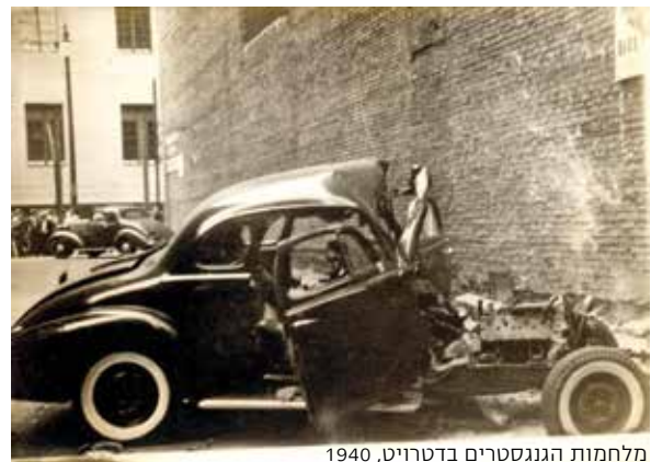
מלחמות הגנגסטרים בדטרויט, 1940