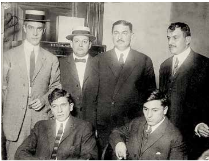
"שמע ישראל" בכיסא החשמלי: Gyp the Blood הוורביץ ולפטי רוזנברג (יושבים)