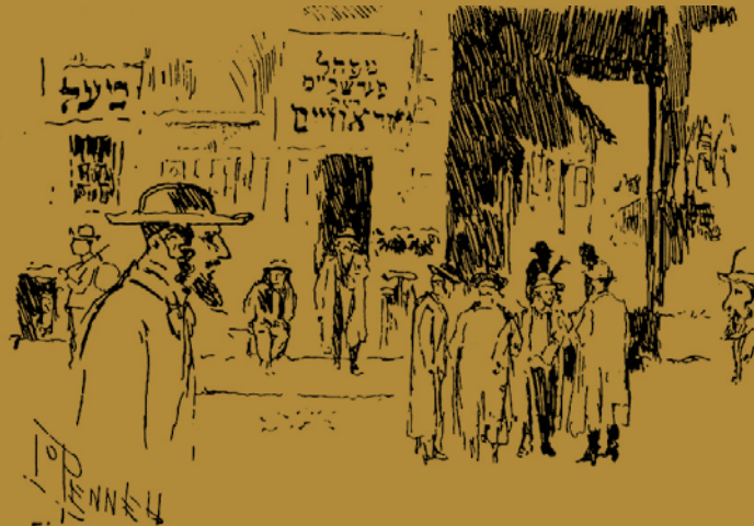
הרובע היהודי בסיגט, בירת מחוז מרמורש (איור: ג' פנל, 1892)

עלייתם של יהודי מרמורש לארץ ישראל לפני השואה