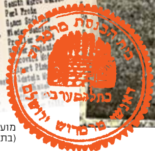
זומעדים לעלייה של "המזרחי" בסיגט ומקצועם (בתעתיק מעברית), 1934