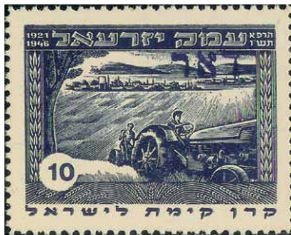
חלוצי העמק בבול "ק"7: היכן אנשי כפר גדעון?

לקראת סוף המאה ה-19 התגברה עליית יהודי מרמורש החרדים, והם המשיכו להתיישב בעיקר בצפת ובירושלים. בראשית המאה ה-20 פרצה מחלוקת קשה בין הרבנים מסיגט ומוויז'ניץ על איסוף וחלוקת הכספים שנועדו לתמוך בעולים משני הפלגים החסידיים העיקריים של מרמורש. בעקבות המחלוקת הקימו שתי החצרות כוללים נפרדים, ופרסמו כרוזים וחוברות שהופצו במזרח אירופה ובארצות הברית לאיסוף תרומות. ממסמכים אלו עולה שמספרם של יוצאי