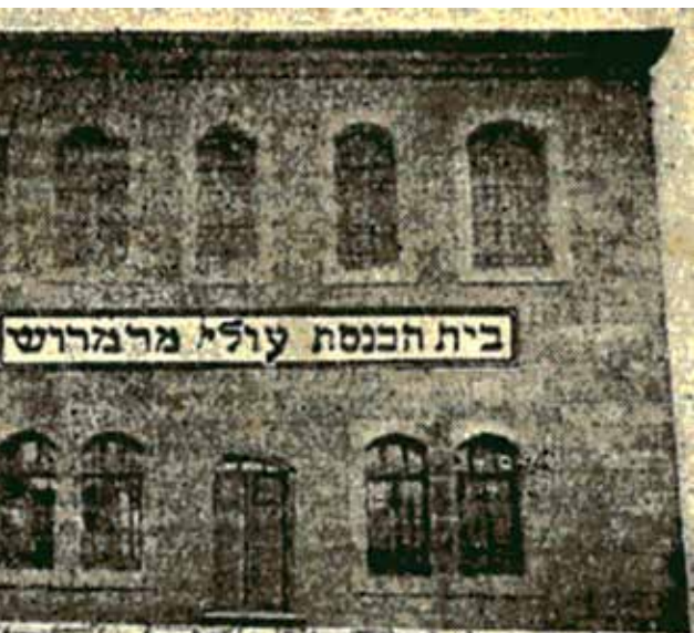
בית הכנסת עולי מרמורש בירושלים (השלט "הודבק" לתמונה)