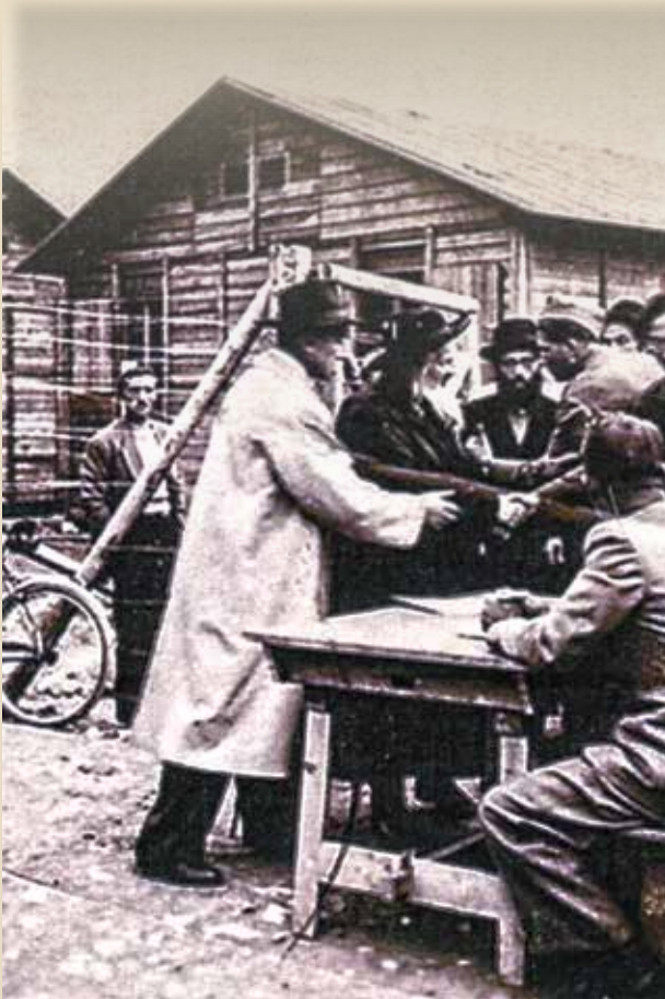
הרבי מסאטמר (שני משמאל) בהגעתו לשווייץ, 1944