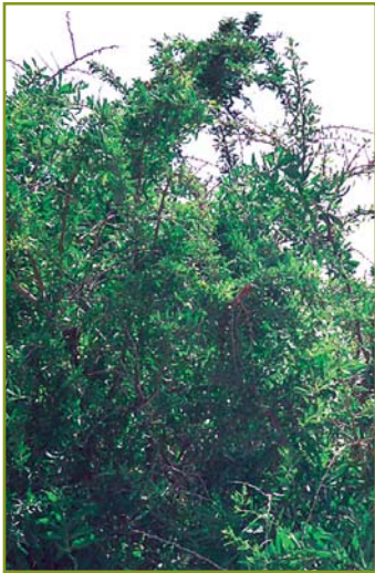
אטד. אלה אטלנטית.

בהר הנגב ובערבה גדלים בערוצי הנחלים מיני עצים אחדים. הנפוצים שבהם הם שיטה סלילנית ושיטת הנגב . אלה אטלנטית היא נדירה וגדלה רק בהר הנגב (בנחל אלות ובנחל צין), שבו יש שילוב של טמפרטורות נמוכות וכמות משקעים גבוהה יחסית. העצים עשויים להגיע לגובה של כ-15 מ' והם מנצלים כיסי קרקע המקבלים יותר מים. שיטת הנגב עמידה בפני קור וגדלה ברמות הגבוהות, ואילו השיטה הסלילנית ושיטת הסוכך גדלות באזורים הנמוכים והחמים, בעיקר בעמק הערבה. עצים נוספים הגדלים בנגב הם עצי שיזף, אשל הפרקים ואשל היאור . מיני האשל גדלים באותם אזורים שבהם רמת המליחות בקרקע גבוהה. בקרבת מעיינות נמצאים גם עצי צפצפת הפרת, תמר ותאנה הזקוקים למים זמינים.