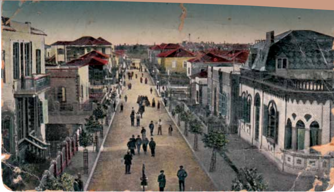
גלויה עם תמונת רחוב הירצל בתל אביב, מימין בית עקיבא אריה ויס (רח' הירצל 2)

שנכתבו בשנת 1934 – אולם האגודה נוסדה 28 שנה קודם לכן! האם אגודת אחוזת בית קמה לתחייה בשנת 1934?