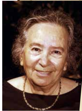
אחוזת בית ויס (למעלה: קברה)