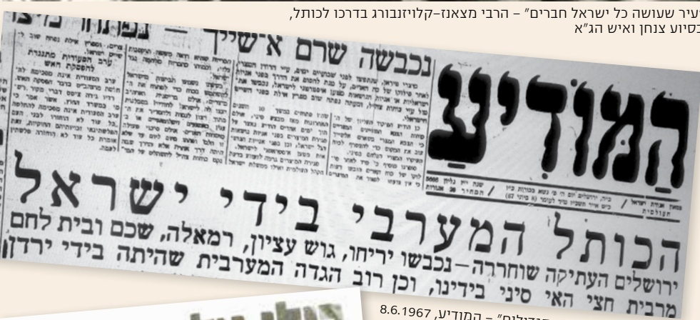
"השיא במאורעות הימים הגדולים" - המודיע, 8.6.1967

לא כל החרדים התלהבו מן הניצחון במלחמת ששת הימים. הרבי מסאטמר אמנם התיר לחסידיו לקיים תפילות ולאסוף תרומות למען מדינת ישראל ערב המלחמה; אולם לאחריה טען כי הניצחון שהושג בה היה מעשה ידיו של השטן שביקש לבלבל את עם ישראל. לפיכך, הרבי קבע כי אסור לבקר בכותל המערבי וביתר המקומות הקדושים ששחררו משלטון ירדן. השקפה זו, שלה היו שותפים רק מיעוט רבנים, לא התקבלה אפילו על דעתם של רוב חברי "העדה החרדית". מרביתם פקדו את הכותל המערבי ואת יתר המקומות הקדושים דרך קבע, למרות שהרבי (לפחות להלכה) היה סמכות רוחנית עליונה עבורם. מרבית הפוסקים הסכימו עם האיסור ההלכתי לעלות להר הבית, שעליו הכריזה מועצת הרבנות הראשית.