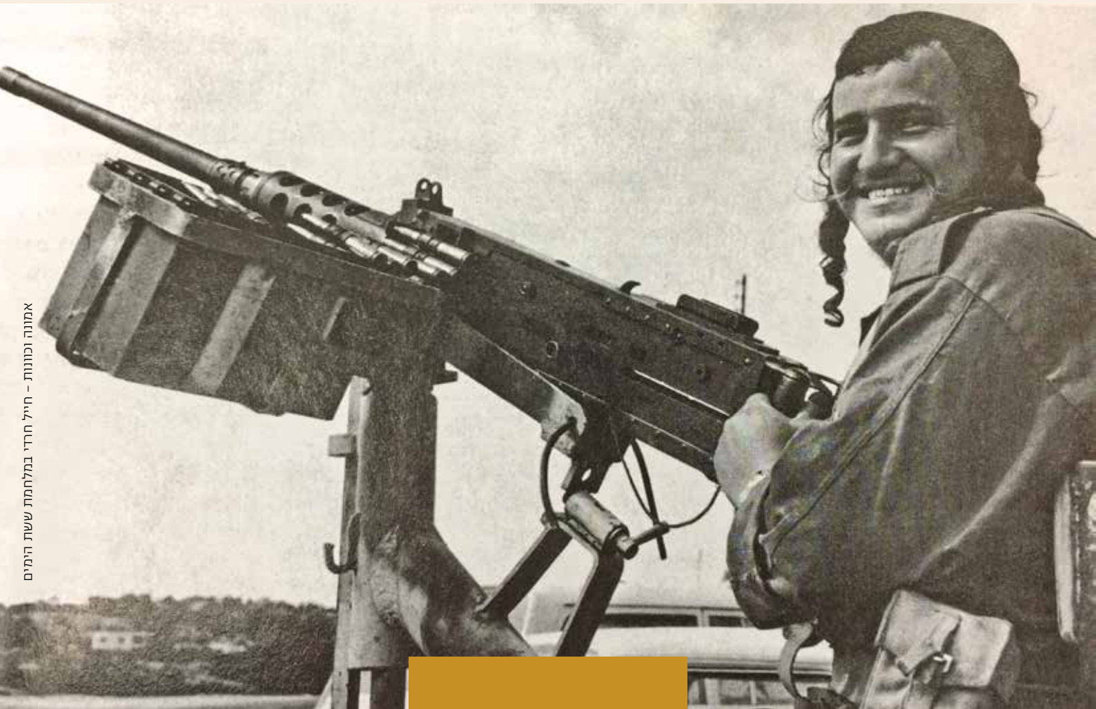
אמונה וכוונות – חייל חרדי במלחמת ששת הימים