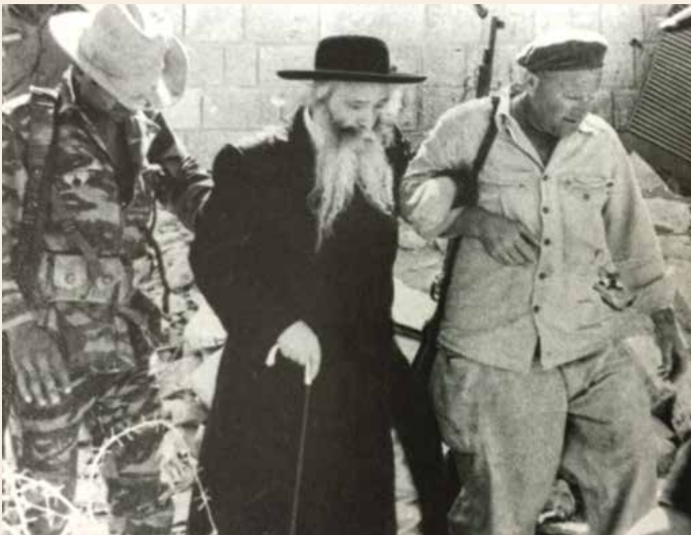
"עיר שעושה כל ישראל חברים" - הרבי מצאנז-קלוזנבורג בדרכו לכותל, בסיוע צנחן ואיש הג"א

המערבי ולשאת שם תפילות, על אף קשיי הנגישות ששררו במקום לאחר שהחלה הריסת שכונת המוגרבים והכנת רחבת הכותל (לעיל, עמ' 1-4). מנהיגים חרדים נוספים הודיעו על כוונתם לחדש את פעילות מוסדות הדת החרדים שבעיר העתיקה. לאחר פתיחתו של הכותל לציבור הרחב בחג השבועות, פגשו בו החרדים הרבים שפקדו אותו יהודים מכל גווי הקשת הדתית: חובשי כיפות סרוגות שיצאו בריקודים עם חילונים שחשו התפעמות דתית; יהודים ספרדים שהתפללו בנוסחים חדשים עבורם; והמוני יהודים מכל העדות והמעמדות, ובהם גם תושבי העיר העתיקה לשעבר.