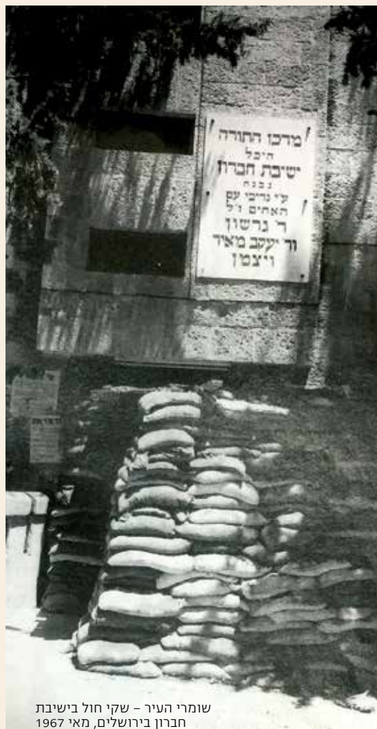
שומרי העיר - שקי חול בישיבת חברון בירושלים, מאי 1967