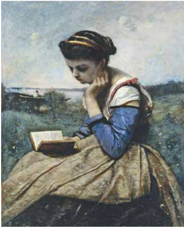
(J.B. Camille Caurot, 1870; Metropolitan Museum of Art)