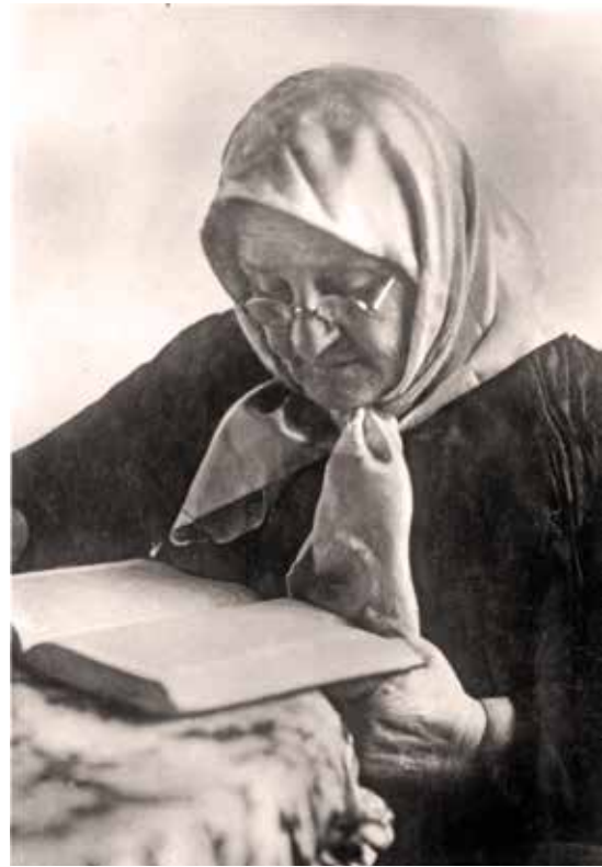
אישה קוראת ב"צאינה וראינה", ראשית המאה ה-20

ואילו רוב הבנות קיבלו את החינוך בביתן מאימותיהן; זאת בשל הערך המועט שהעניקה החברה לחינוך הבנות, בצד תפיסת הצניעות המסורתית שלפיה ראוי לה לבת לשהות כמה שפחות מחוץ לביתה ("כל כבודה בת מלך פנימה"). לא רק סדרי הלימוד של הבנות היו שונים מאלו של הבנים, אלא גם התכנים. הבנות רכשו את יסודות הקריאה בלשון הקודש – לצורך התמצאות בסידור ובחומש – אך לא מעבר לכך. לעתים קרובות רכשו גם את יסודות החשבון, וכן מלאכות שונות כמו תפירה או רקמה.