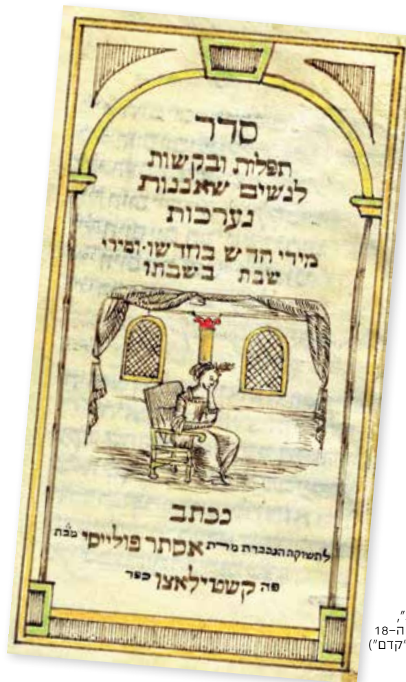
ספר תפילות לנשים שאננות, איטליה, המאה ה-18

ר' משה הענוכש ירושלמי אלטשולר חיבר במאה ה-16 את ספר המוסר "ברנטשפיגל", שיועד במידה רבה לנשים. מתוך הצורך שחש להתנצל על כך שכתב את ספרו בידיש ולא בלשון הקודש, הוא נעזר במשל מן הגמרא (סוטה מ ע"א) העומד על ההבדל בין הרב הדורש בדברי הלכה לזה הדורש בענייני אגדה. לדבריו, דומה מחבר הספרים בלשון הקודש – כזה הדורש בהלכה – למוכר אבנים טובות, ואילו המחבר ספרים בידיש – בדומה לדורש באגדה – משול למוכר מיני סדקית. סחורתו של הראשון אמנם איכותית ויוקרתית יותר, אך רק קונים מעטים יכולים ליהנות ממנה. כך גם הספרות בידיש לעומת הספרות שבלשון הקודש: עממית יותר ויוקרתית פחות, אך כזו המגיעה אל הציבור הרחב ולא רק ליחיד סגולה. ככזו, הפכה הספרות הדתית בידיש לגורם ראשון במעלה בהפיכת הציבור הנשי לציבור בעל ידע תורני משמעותי; ציבור שצרך בקביעות ובלהט מיני סדקית שיקרו בעיניו כאבנים טובות.