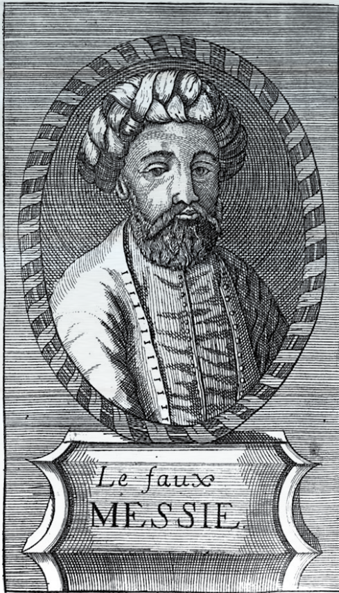
דיוקן שבתי צבי "משיח השקר", 1728 (J.B. de Rocoles)

בשנת 1665 הופיע שבתי צבי כמשיח וחולל את אחת הדרמות הגדולות בתולדות העם היהודי. מעשיו ומנהגיו החריגים התפרסמו ברחבי הקהילות, ורבים חשו שהנה הגיע המשיח וכי עוד רגע ייגאלו. ההתעוררות הגדולה הפכה לאכזבה קשה כאשר מועצת הסולטאן אילצה בשנת 1666 את שבתי צבי לבחור בין התאסלמות למוות, והוא התכחש בפני שופטיו לתנועה המשיחית שסביבו ובחר באסלאם. מאמיניו המאוכזבים חזרו ברובם לחיק היהדות, ומיעוטם התאסלמו (כעבור כמאה שנה היו גם שהתנצרו, בהנהגת יעקב פרנק). מנהיגי הקהילות אסרו להזכיר את שמו, ובמקורות ההיסטוריים נותר רק הד עמום לטראומה שטלטה רבבות יהודים. שבתי צבי הפך בתודעה הלאומית לגדול משיחי השקר.