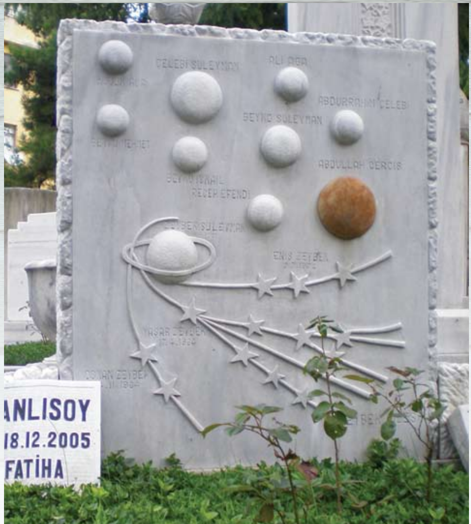
מצבה שבתאית ייחודית בבית הקברות באיסטנבול

עתידות? בוודאי ימשיכו את קיומם, עד אשר תכבה הגחלת האחרונה, השומרת עדין את אופיים המיוחד של מאמיני שבתי צבי האחרונים.