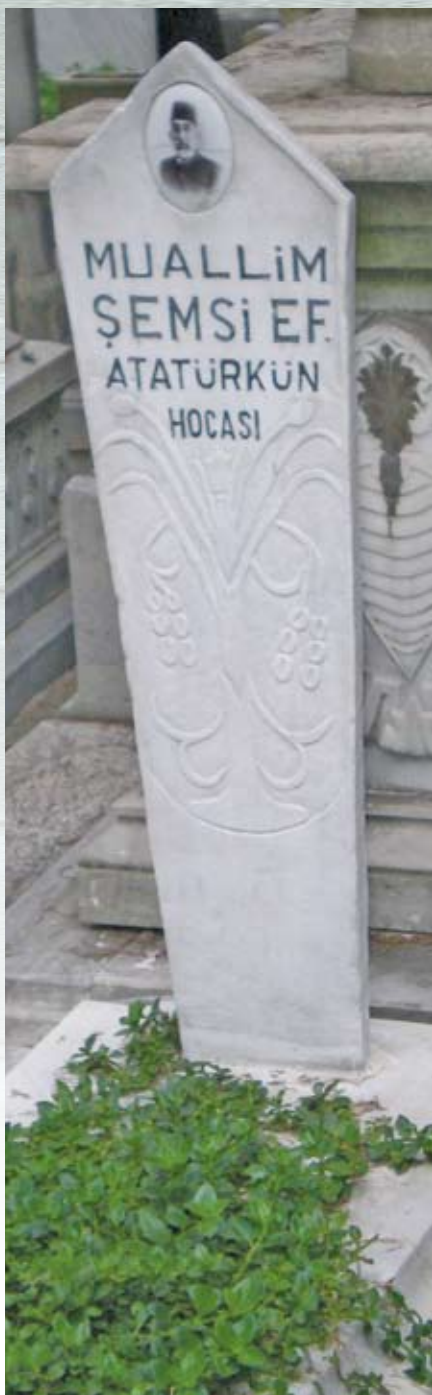
קבר שמסי אפנדי, מורהו השבטאי של אתאטורק, איסטנבול