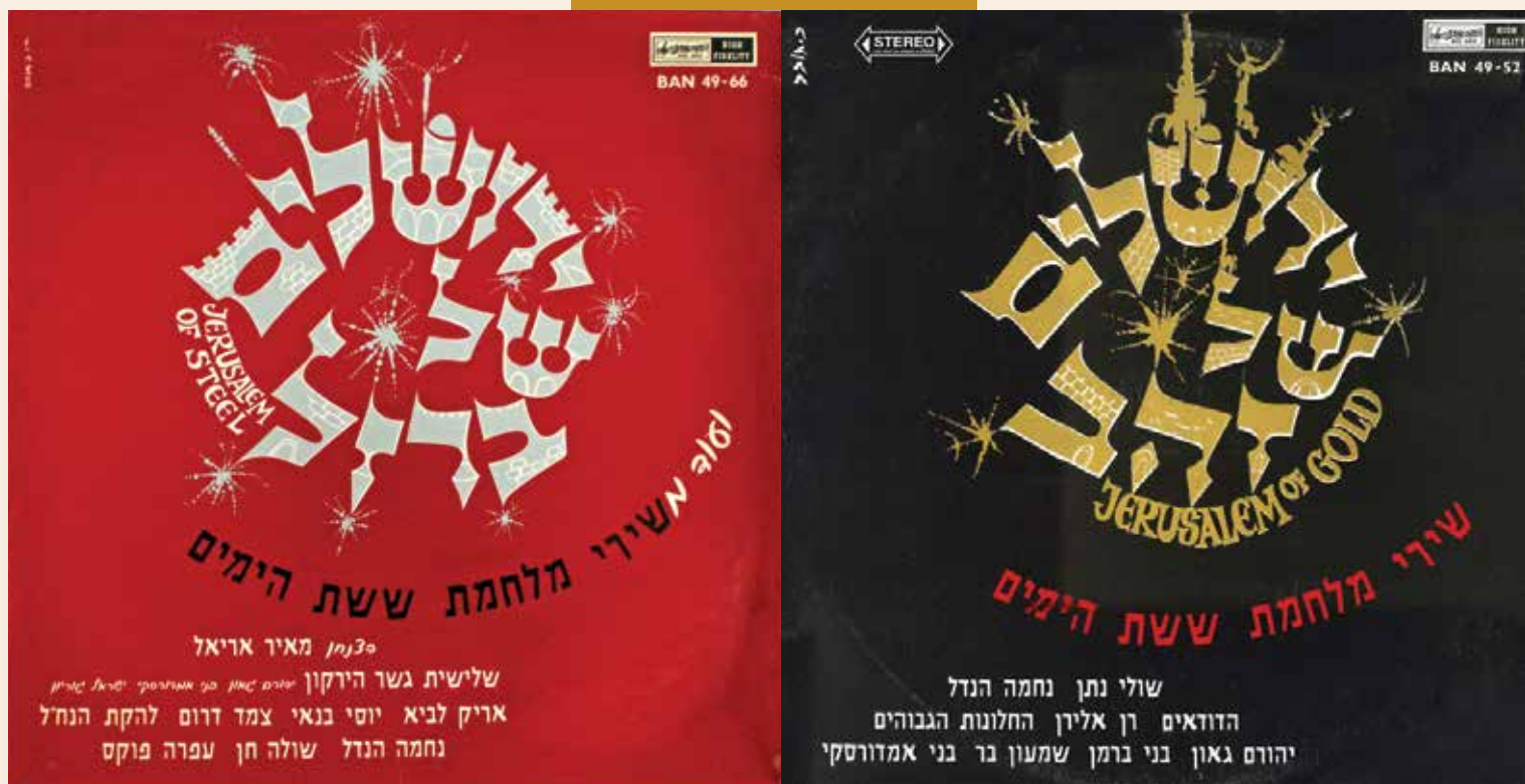
(אתר "סטריאו ומונו")

נמנעת. כך הושרו שורות כמו: "הַחֲזִיקִי לָנוּ אֶצְבְּעוֹת / עַד סוֹף הַתְּמָרוֹנִים" ("החזיקי לנו אצבעות", רימונה די־נור ונורית הירש) ו"אֲנַחְנוּ נַעֲבֹר בְּמִצְרַיִם טִיֶּבָאן [...] אֶת כָּל הַמִּצְוִרִים / אֲנַחְנוּ נִפְרָצִים" ("אנחנו נעבור", יחיאל מוהר ומשה וילנסקי); ובאווירת ההמתנה: "תִּתְקֶף יִרְעָמוּ הַתּוֹתָחִים [...] וּמְחַפִּים וּמְחַפָּים" ("לילה בדרום", חיים חפר ואלכסנדר ארגוב). היו גם שירים בוטחים ומתגרים: "נֶאֱצֹר מְחַפָּה לְרִבִּין... כִּי נְבוֹא מֵאָה אֲחוֹז" ("נאצר מחכה לרבין", חיים חפר ולחן חסידי) ו"נִכְנְסִים לְכֶם כְּמוֹ בֶּ-48' וּבֶ-56'" (יורם טהרלב ואורי זהר, ללחן השיר "חפש אותי" של נעמי שמר). וירושלים? אין לה זכר ב'שירי ההמתנה', רק "ירושלים של זהב", שהושמע לראשונה בפסטיבל הזמר במוצאי יום העצמאות תשכ"ז (15.5.1967), וכעבור שלושה שבועות הפך להיות השיר ששרו החיילים שהגיעו אל הכותל המערבי במלחמה. השיר הוזמן במיוחד לפסטיבל הזמר ע"י ראש עיריית ירושלים טדי קולק, מחוץ לתחרות, ורק יד המקרה (ואולי מעין חוש נבואי) יצרו את החיבור המדהים בין ירושלים למלחמה. המתיחות שהייתה בירושלים החצויה מאז