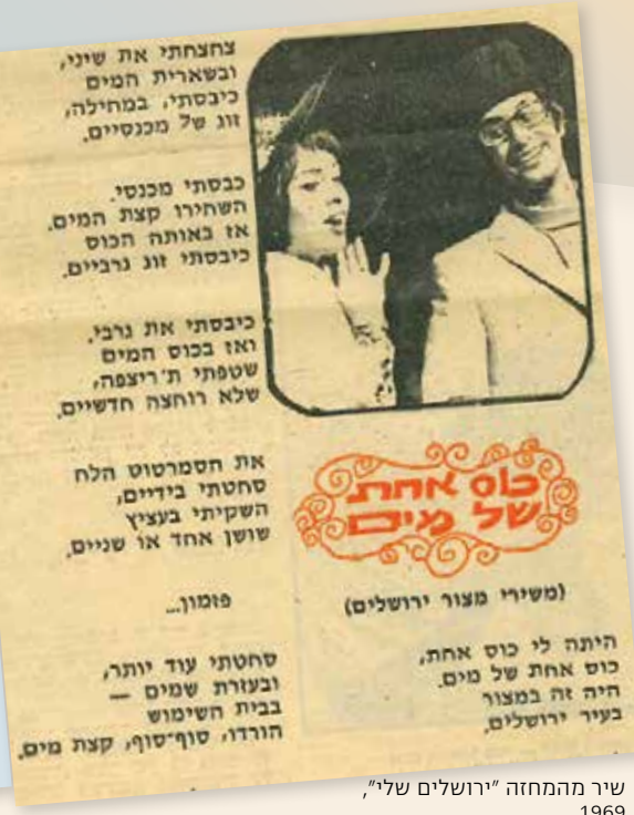
שיר מהמחזה "ירושלים שלי", 1969

מרכבתו של מונטיפיורי אף מככת בסרט, במסעה האחרון. אלה ואחרים מבטאים את הקשר עתיק היומין לעיר, שחודש במלחמה: "הִלְמּוּ רַגְלֵי הַמְּבַשֵּׁר עַל הָהָרִים [...] שְׁבַנּוּ אֶלֶיךָ, עִירוֹ שֶׁל דָּוִד" (השבועה לירושלים, עקיבא נוף) ו"חֲחוּק וְקָרוֹב שְׂאֵי מִכָּל עִבְרֶיךָ [...] בְּשׁוֹבֵךְ אֶלֵּי קִדְמַת נְעוּרֶיךָ" (ציון הלא תשאל, ר' יהודה הלוי, לחן: נורית הירש). נוסף למונטיפיורי, שזכה לשהות בעיר, מתחזק הקשר העמוק