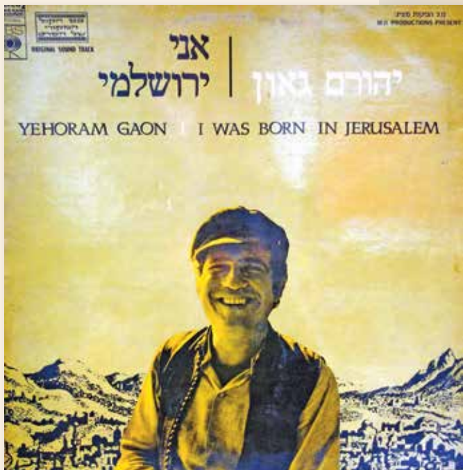
תמונות התקליטים: אתר "סטריאו ומונו"