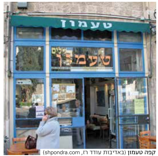
קפה טעמון