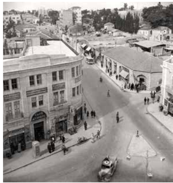
מבט על קפה אירופה בכיכר ציון