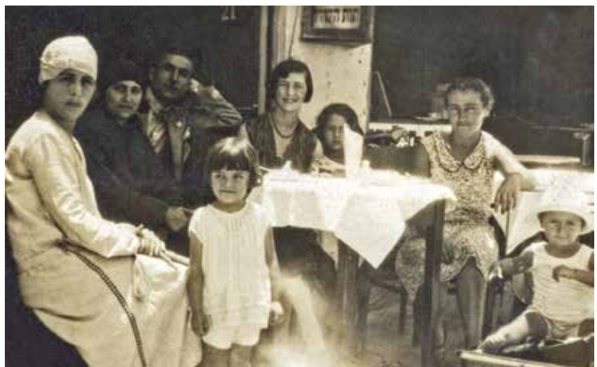
ננות משפחת ולירו בבית קפה