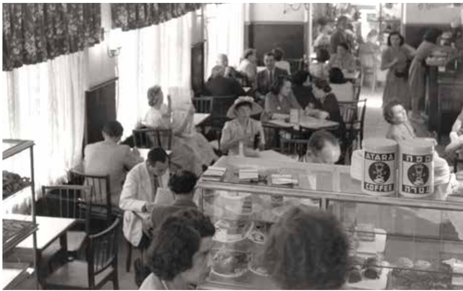
קפה עטרה, 1950