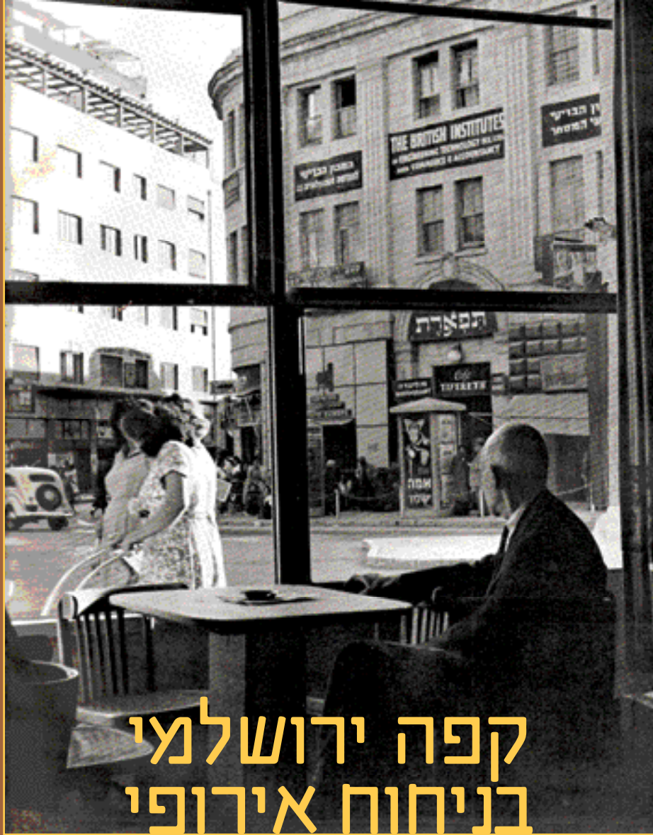
מבט מקפה וינה על כיכר ציון, 1950