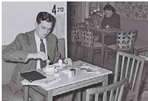
בית קפה זיכל בשנות ה-40

של עכשיו. כנהוג תפסו החזקים את הספות הרכות והמקומות הרומנטיים. [...] התזמורת מנגנת קטעים של כרמן וריגולטו בלי חסד עליון.