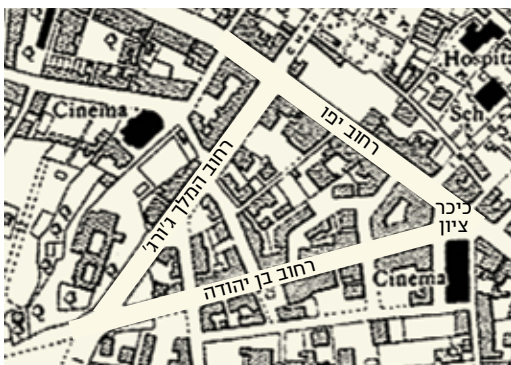
ה'משולש' במרכז ירושלים

לעומת בתי הקפה הערביים המסורתיים בהם ישבו רק גברים, שיחקו שש-בש ועישנו נרגילה תוך לגימת קפה שחור, הרי שבבתי הקפה בנוסח האירופי שצצו בירושלים לאחר כיבוש העיר, ישבו גם נשים, עישון הנרגילה הוחלף בעישון סיגריות ובמקום שש-בש שיחקו שחמט. אנשים באו גם כדי לקרוא עיתונים וישבו לעתים שעות ארוכות ועברו על העיתונות היומית בתמורה לכוס הקפה שהזמינו. בכל בית קפה היו מעמדים במבוק שעליהם נפרשו העיתונים והקוראים החזיקו בזרוע במבוק את המעמד שעליו פרסו את העיתון וכך קראו. העיתונים הנפוצים, פרט לעיתונות העברית, היו הפלסטיין פוסט באנגלית והעיתונים בגרמנית ידיעות חדשות וידיעות היום. יש לציין שבתקופה זו הגיעו