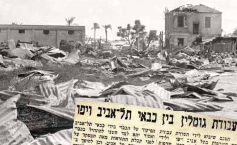
עקבות שריפה ביפו, 1936