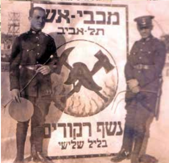
כתבות ב"דבר" ו"הבלקר", 1939 (ארכיון כבאות והצלה ת"א)