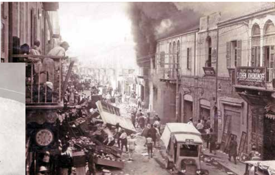
השריפה ברחוב בוטרטוס, 1925