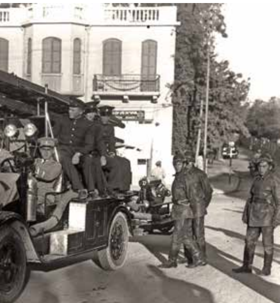
כבאי תל אביב, 1934