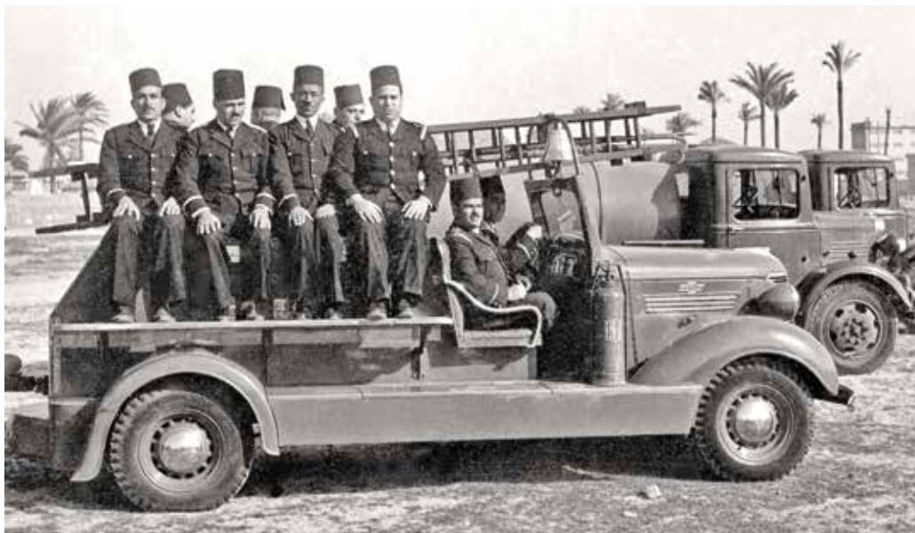
תרגיל מכבי האש ביפו, שנות ה-40

אביב. אולם במקביל, מועצת עיריית יפו החליטה להעניק שוב תמיכה כספית לגדוד מכבי האש של תל אביב. דווח כי: "מועצת העירייה הקציבה 10 לא"י לפלוגת מכבי האש המתנדבים בת"א, שהשתתפה במסירות בכיבוי האש בכל מקרי הדליקה האחרונים ביפו" ("דבר", 19.1.1928). עוד עולה מהידיעה כי כמה מערביי יפו תרמו כספים לגדוד מכבי האש של תל אביב. יוזמת הגדוד היפואי, כמו גם הדוח שהוגש למושל המחוז, נשארו ככל הנראה בגדר כוונות בלבד.