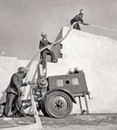
מכבי האש ביפו, שנות ה-40