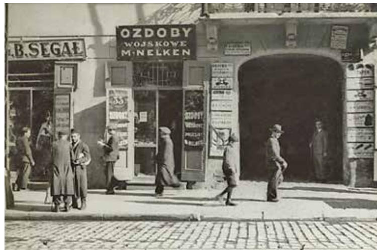
יהודי פולין, ורשה יולי 1933 (אלבום תצלומים של ותיקי מלחמת העולם הראשונה, הספרייה הלאומית)