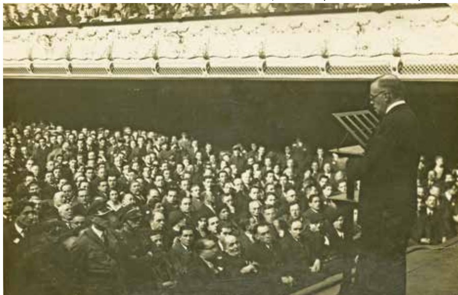
ז'בוטינסקי נואם בפני יהודי פולין בוורשה, 1936