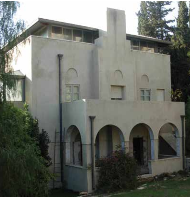
בית ג'ייקובס, חזית הכניסה למזרח (יד לוי אשכול)