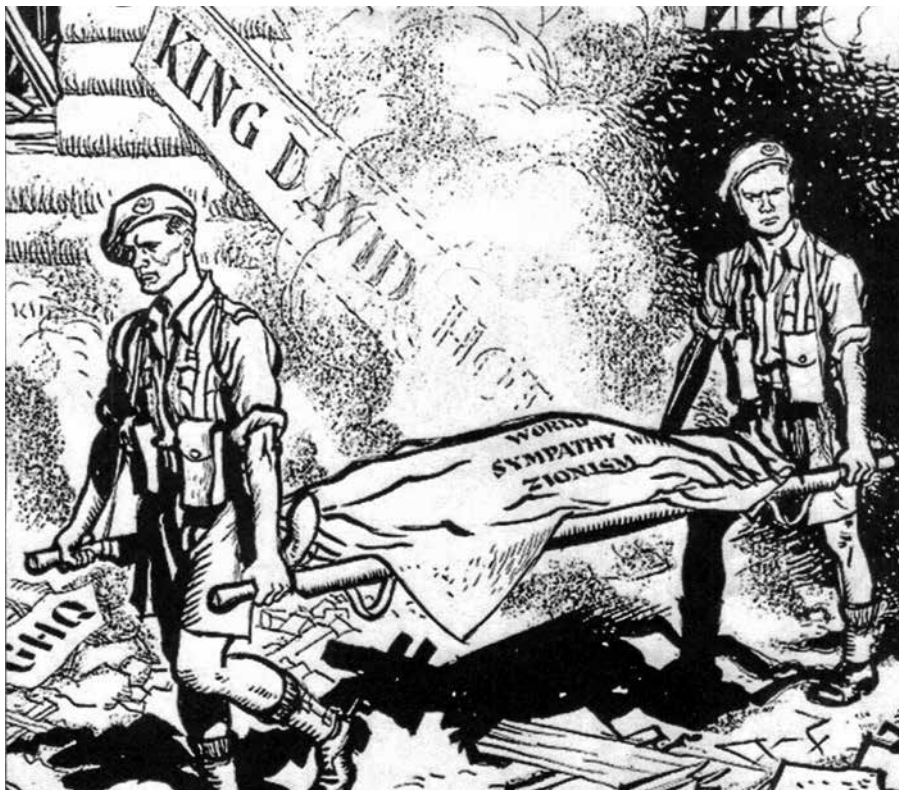
הריסות מלון המלך דוד, איור ב-Daily Mail: פיינוי "אהדת העולם לציונות"