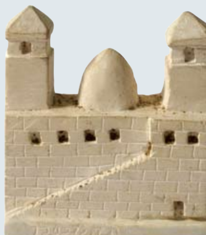
מלמעלה למטה: דגמי יד אבשלום (קרמיקה), קבר רחל ומערת המכפלה (יציקות גבס), 1907 בקירוב

עיתון "האור" הוסיף: "בפינה נסתרה וענוה הונח יסוד לבית נכות קטן ירושלמי, בית נכות מצוין במינו". בדגם בית הכנסת "החורבה" שיצר, הדגים רוזין גם את פנים ההיכל, הדוכן, הספסלים וצבעיהם. בדגם קבר רחל פירט את פנים הקבר, את המצבה ואת העיטורים והכיתובים על הקירות. בתוך אחד מדגמי הבתים שבנה הושיב יהודי הרכון על תלמודו, בשעה שזוגתו מכבדת את רצפת הבית. למעט דגם שכונת בתי ראנד, שכיום אין ידוע מקום הימצאו, הוצגו שאר הדגמים בראשית שנת תש"ע בתערוכה "מזכרות מארץ הקודש", במוזיאון חצר הישוב הישן ברובע היהודי. בהקשר זה יש לציין שבניית דגמי עץ של מבנים הייתה נהוגה בירושלים שנים רבות לפני מאיר רוזין: כבר במאה ה-16 ציווה נסיך הפפאלץ אוטו היינריך לבנות דגם מעץ של ירושלים, המוצג כיום במוזיאון הלאומי במינכן. במוזיאון הפרנציסקני בירושלים נמצא דגם של כנסיית הקבר מהמאה ה-17, עשוי עץ ומשובץ צדף. דגמים מעין אלו