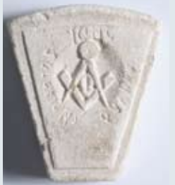
סמל מסדר הבונים החופשיים על אבן ממערת צדקיהו, 1907 בקירוב