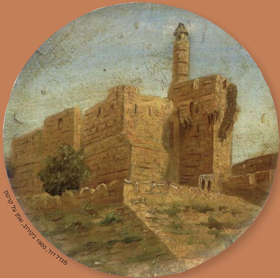
מגדל דוד, 1900 בקירוב. שמון נגי קרטון