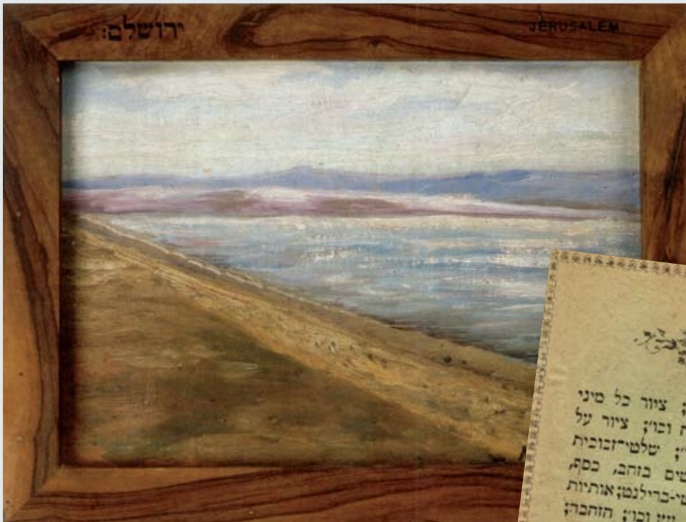
חוף ים, שמן על בד, 1900 בקירוב