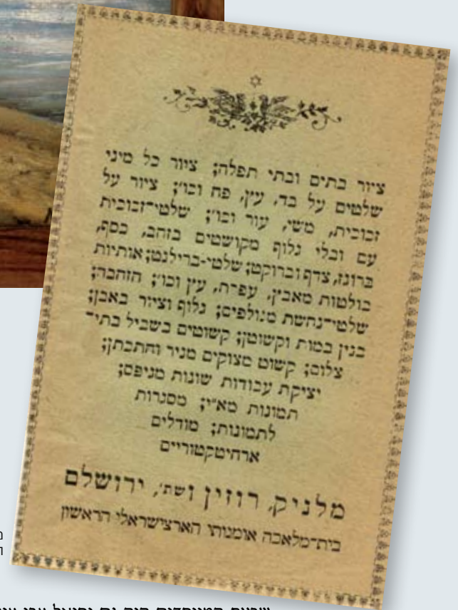
פרסומת לבית המלכה, 1909