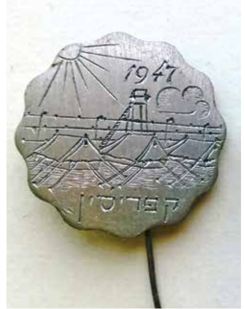
סיכה לבגד - חריטה על מטבע קפריסאי שהחלק

אזלו ליצחק אשהיים והניסיונות להשיג צבעים חדשים במחנה 55 המבודד לא צלחו, הייתה זאת דווקא שליחת מפא"י שנתנה ליצחק הבית"רי את קופסת צבעי הגואש האחרונה שנשארה באמתחתה. עם הצבעים החדשים צייר יצחק 'שנות טובות' צבעוניות לראש השנה תש"ח ותש"ט וגלויות צבעוניות לאירועים שונים. את הגלויות הללו שלח מהמחנה בקפריסין לקרובי משפחתו בארץ. לצד נופי המחנות, אוניות המעפילים והמבט לאופק הארץ המובטחת, ניכרת ב'שנות טובות' ה'בית"ריות' של יצחק גם ההכנה ללקראת הגנת העם וכיבוש המולדת. את הדואר שלחו לארץ באמצעות השליחים, או באמצעות סניף הדואר שנפתח על ידי ועד המחנות ומכר בולי דואר קפריסאיים. עיתון 'הבוקר' מ-3.2.1948 כותב שנעשו הצעדים הראשונים לקשר אווירי קבוע בין הארץ והמעפילים, ולשם זה באו הג'וינט בקפריסין וירושלים והוועד למען גולי קפריסין לידי הסכם עם חברת אווירון על הבטחת טיסות קבועות במטוס הדו-מנועי מלוד לניקוסיה וחזרה.