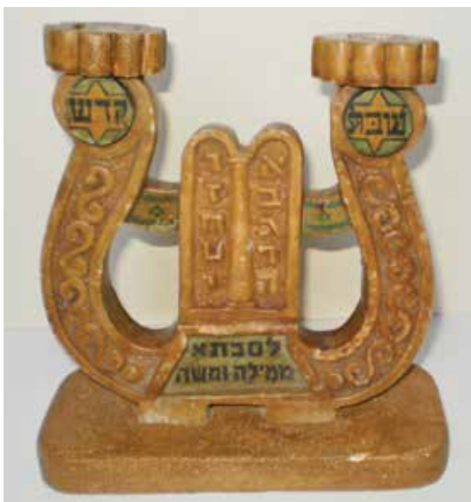
פמוטים לשבת עם הקדשה, אבן לרנקה