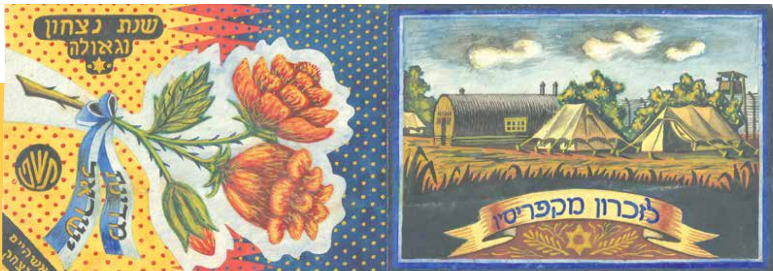
'שנה טובה' - צבעי גואש על קרטון (ציור: י. אשהיים)