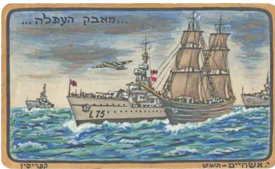
‘שנה טובה’ - צבעי גואש על קרטון (ציור: י. אשהיים)