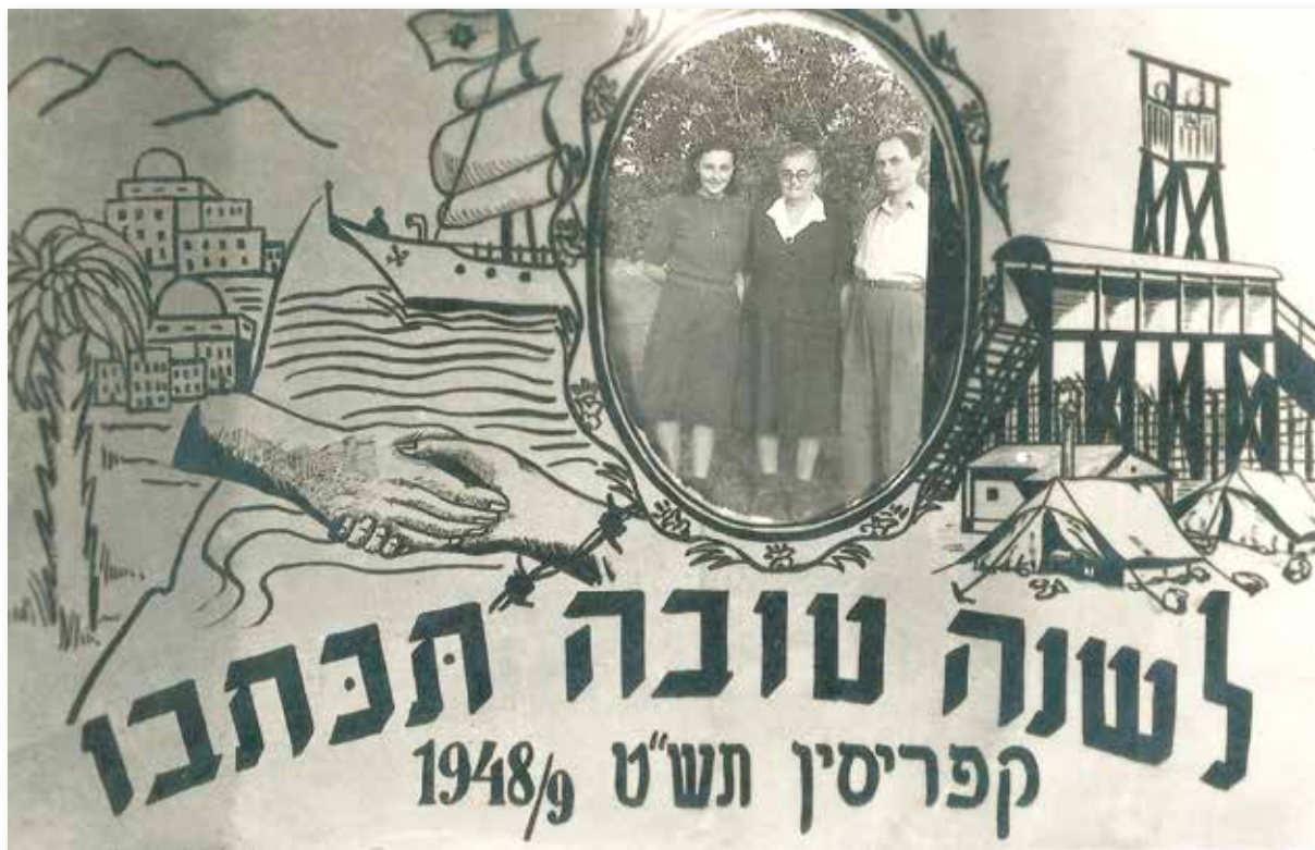
שנה טובה - שילוב צילום וגרפיקה