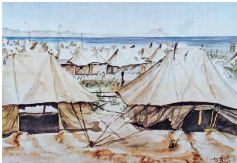
מחנה המעפילים בקפריסין, ציור: שמואל כץ