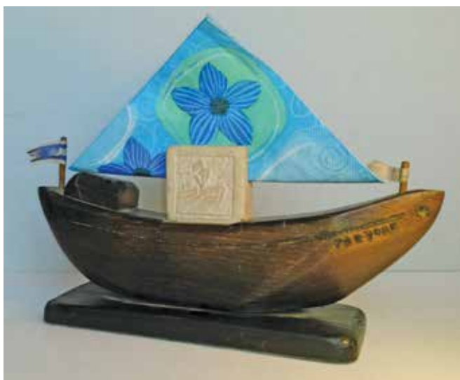
מחזיק מפיות בצורת אניית המעפילים "פאן יורק", גילוף עץ ואבן לרנקה