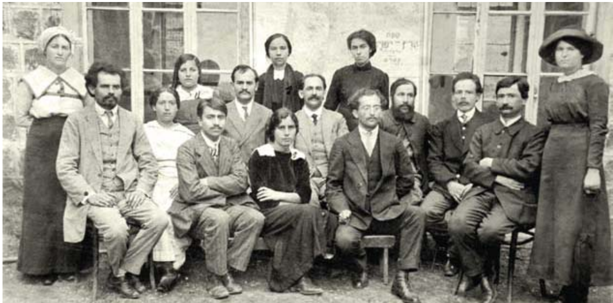
מורי בית הספר ביבנאל – "בי"ס היותר גרוע ובלתי משוכלל בכל הגליל", 1915

ביטאונה של הסתדרות הפועלים העברים, לא היסס לתאר את המסע באור שלילי ולהציגו ככישלון של הרבנים למול החלוצים הפעלתנים. ביום 26.12.1913 נכתב בו: "ועדת הרבנים שנסעה במושבות הגליל להכניס בהן תיקונים דתיים ולהעמידן על טהרת הקודש, לא פגשה תשומת לב מרובה בגליל התחתון. האיכרים והפועלים שבגליל התחתון, עסוקים הם יותר מדי בעבודה, בחרישה ובזריעה, בהגנה על נפשם ועל רכושם ואין לבם נתון כלל לשמוע את 'שבט המוסר' של הרב קוק ובני לווייתו. וכך שבו להם הרבנים כלעומת שבאו, תקן לא תקנו והצלח לא הצליחו בשליחותם".