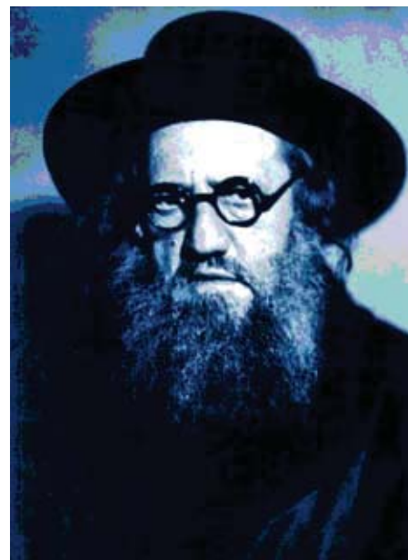
ראשי הרבנים ב"מסע המושבות", מימין: הרב חרל"פ, הרב קוק (בשבתו ביפו) והרב זוננפלד

רחוקים הייתה מועטה. ד"ר יוסי אבנרי, המדריך קבוצות בעקבות המסע, ציין כי "מסע הרבנים, באופן כללי, לא עלה יפה [...] הרבנים לא הצליחו להחזיר אנשים בתשובה וגם לא הצליחו לקיים דו-שיח מתמשך עם המתיישבים. במבט לאחור, רבים הפכו את זה לרגע מוצלח, אבל זה לא נכון. בגדול זו הייתה החמצה" (י' אטינגר, כשהכופרים היו כופרים [והקנאים היו קנאים], "הארץ", 30.10.2007).