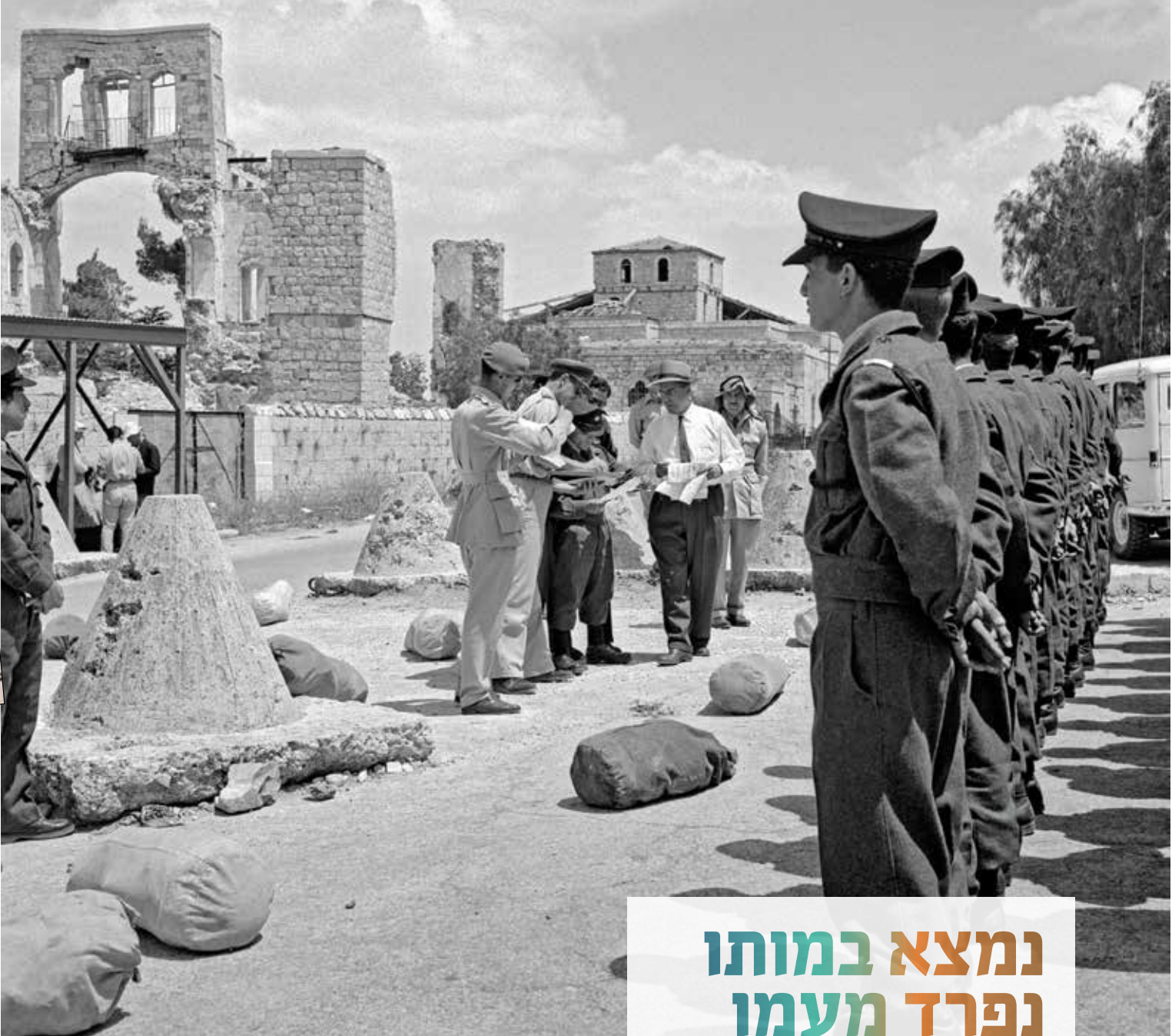
“שוטרים” ישראלים במסדר יציאת השירה לנה הצופים, מעבר מנדלבוים (ארכיון האו”ם)